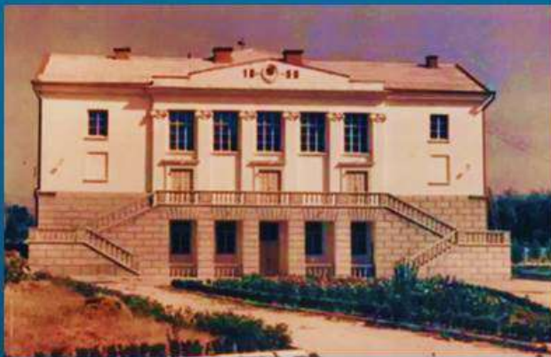
Дом культуры 1960 год

Почетные гости мероприятий — члены общественных организаций «Доброволец», «Боевое братство», «Севастопольский совет ветеранов подводников» и другие. На сегодняшний день 22 клубных формирования Дворца охватывают людей всех возрастов, самому младшему студийцу — 4 года, а старейшему — 90 лет. Участники клубных формирований Дворца являются лауреатами и дипломантами различных конкурсов и фестивалей, в том числе всероссийских и международных. Три творческих коллектива имеют почетное звание «Народный», четыре — «Образцовый».