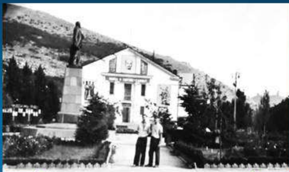
Дом культуры 80-е годы.