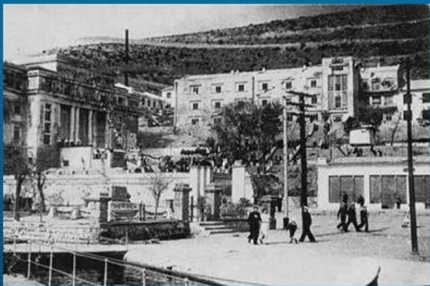
Клуб ЭПРОНа 40-е годы.