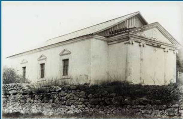
Клуб в селе Флотское 50-е годы