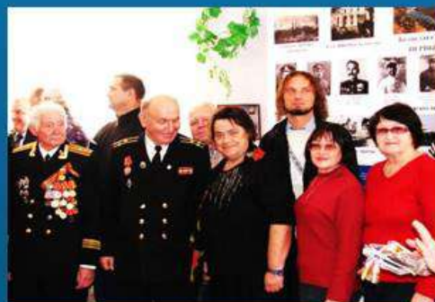
Вечер "Рыцари морских глубин"