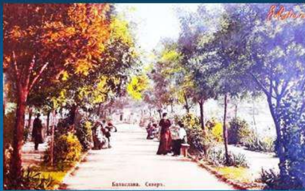
Пушкинский сквер в Балаклаве начало 20 века.

Праздник Дня работников культуры учреждён в стране Указом Президента Российской Федерации №1111 от 27 августа 2007 года. 25 марта — официальная дата празднования