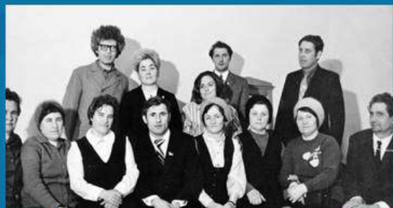
Коллектив Дома культуры 1980 год