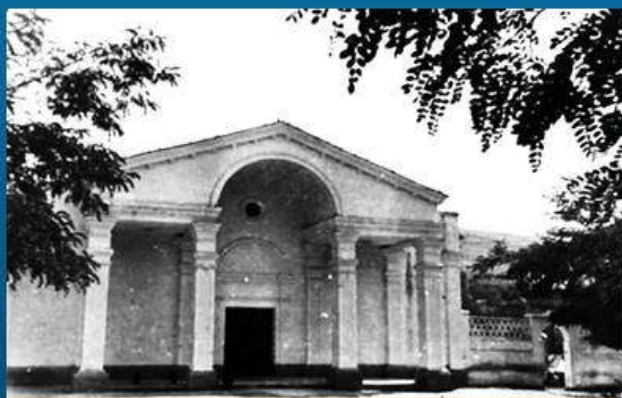
Клуб Кирпичного завода

В клубе работали кружки художественной самодеятельности, был свой вокально-инструментальный ансамбль «Керамик», демонстрировались фильмы, устраивались молодежные дискотеки, проходили интересные лекции и встречи с интересными людьми, с ветеранами Великой Отечественной войны.