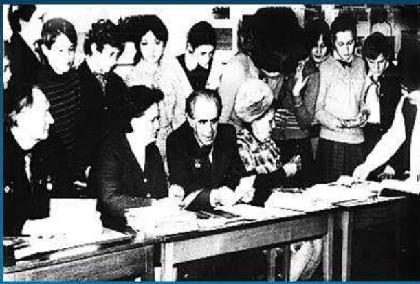
Выборы в Клубе совхоза

Под него приспособили бывшую контору дореволюционного частного винодельческого хозяйства генерала А.Н. Витмера.