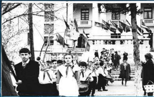
Прием в пионеры ДОФ 70-е годы