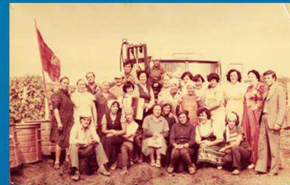
Агитбригада сельских клубов

В середине 90-х годов совхоз агрофирмы «Золотая Балка», ввиду невозможности содержать в должном порядке здания и выплачивать заработную плату обслуживающему персоналу, передал все свои совхозные клубы на отделениях Управлению культуры города Севастополя.