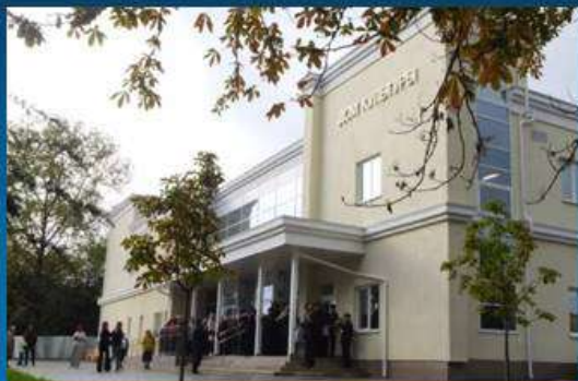
Клуб 1-го отделения «Золотая балка»

В апреле 2023 года в здании Балаклавского Дворца культуры начались ремонтно-реставрационные работы. Временно коллективы распределили по другим учреждениям культуры (занятия на базе), а офисный отдел находился на третьем этаже здания по ул. 7 Ноября.