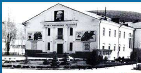
Дом культуры 90-е годы