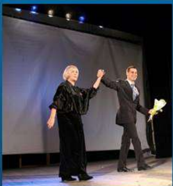
Встреча с Адой Роговцевой

Объекты культуры всегда являются центром жизни любого населенного пункта, где живут люди, ценящие хорошую музыку, поэзию, кино и театр. Здесь практически вся общественная жизнь проходит с участием работников культуры. Большую работу ведут не только государственные учреждения, но и Общественные организации Балаклавы.