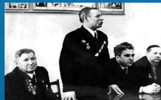
В Клубе ДОФ в Кадыковке