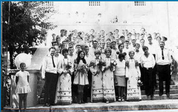
Коллектив ДОФа 80-е годы