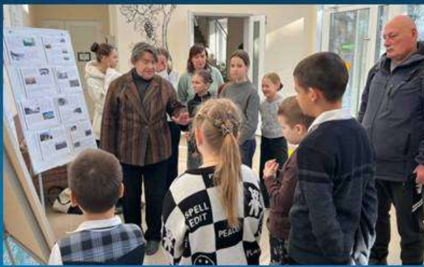
Выставка в вестибюле дворца.