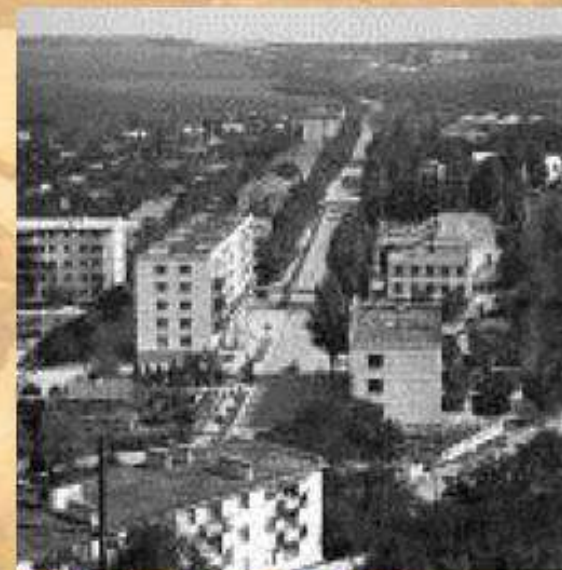
Улица Андрея Крестовского