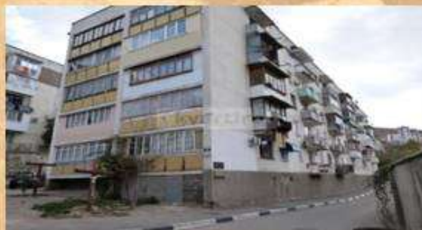
Улица Г.А. Рубцова №17