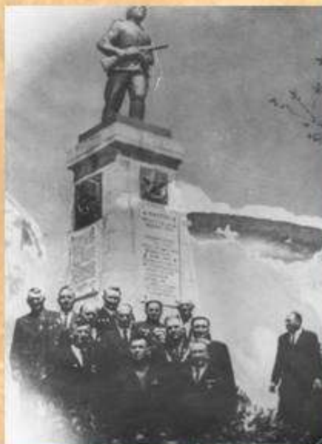
Памятник воинам-освободителям на балаклавских высотах