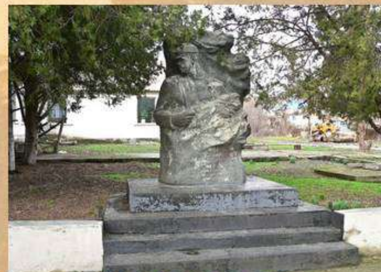
Открытие памятника Ахлестину