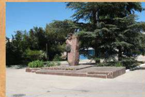
Памятник П.Г. Новикову

31 октября 1961 г. Севастопольское шоссе было переименовано в честь генерал-майора Новикова Петра Георгиевича (1906-1943), улица начинается у перекрестка улиц Калича и Крестовского и заканчивается на 10 километре. 25 марта 1983г. на улице установлен памятный знак (скульптор — В.Е. Суханов).