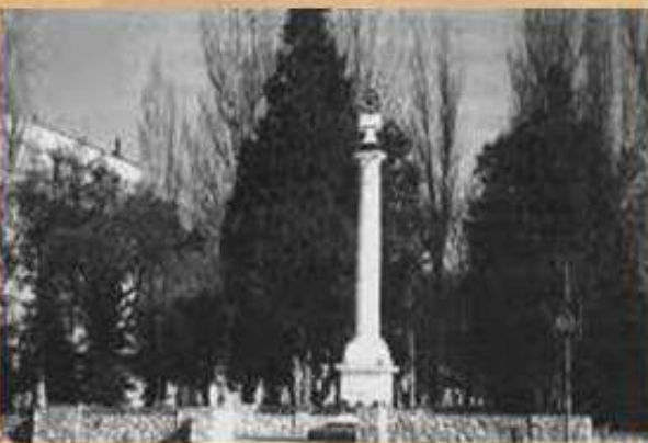
Начало ул. Калича

. 19 октября 1957 года в связи с тем, что Балаклава включена в состав Севастополя, название улиц дублировалось. улицы Советскую и Дзержинского переименовали в честь Андрея Иосифовича Калича. (1892-1946). На доме № 19 установлена аннотационная табличка, сообщающая в честь кого она названа. Улица Андрея Калича начинается от развилки улиц Новикова и Крестовского, являющейся центром исторической части Балаклавы. Она сохранила свое старинное очарование и и заканчивается у Крепостной горы.