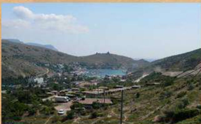
Памятник воинам-освободителям на балаклавских высотах