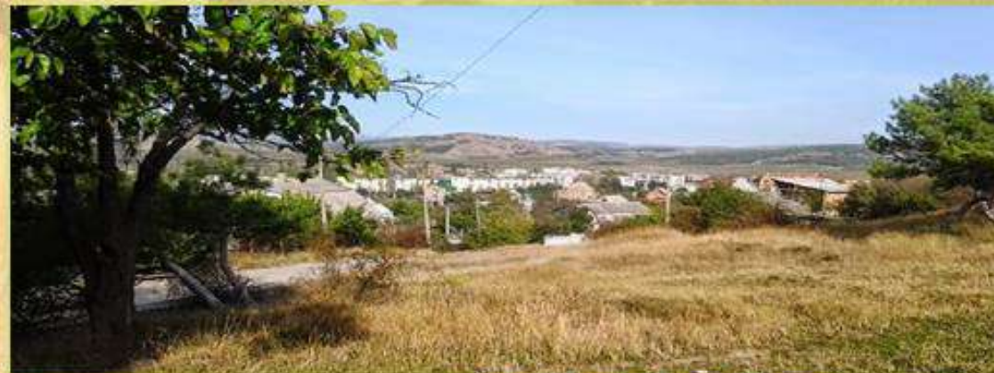
Улица П.Ф. Ситникова