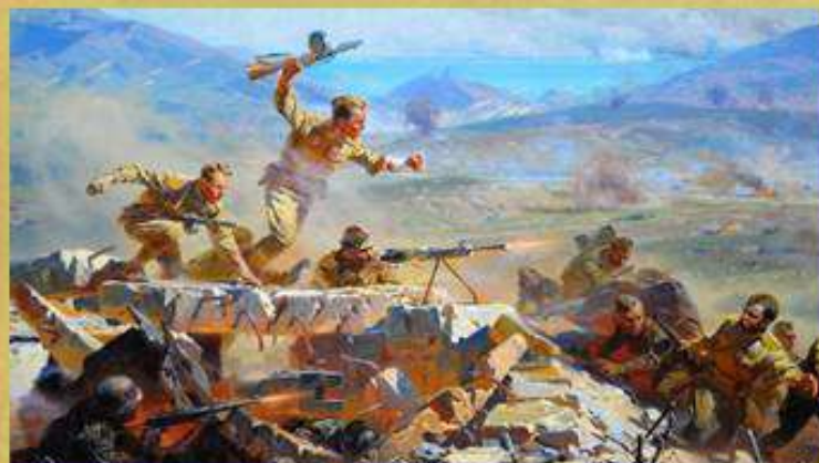
Штурм Сапун горы

В честь 50-летия Победы его имя присвоили одной из улиц Балаклавы.