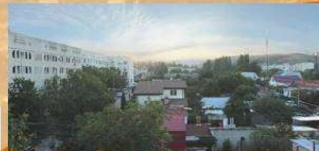
Улица А.С. Терлецкого