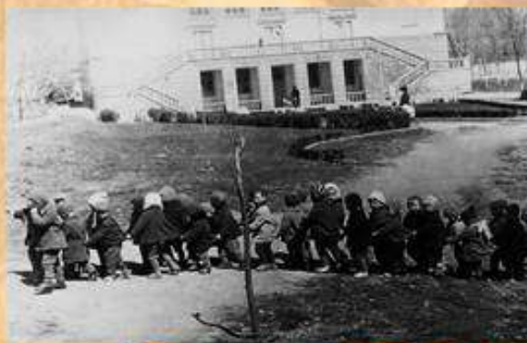
Улица Новикова 1954 г. ДК БРУ