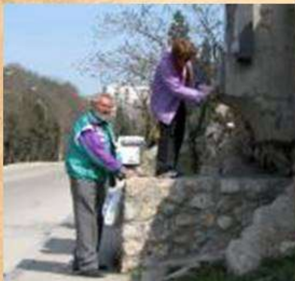
Члены Балаклавского клуба истории ухаживают за памятником