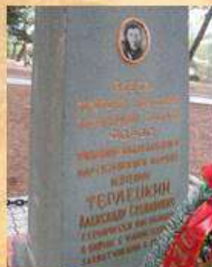
Памятник А.С. Терлецкому в Форосе