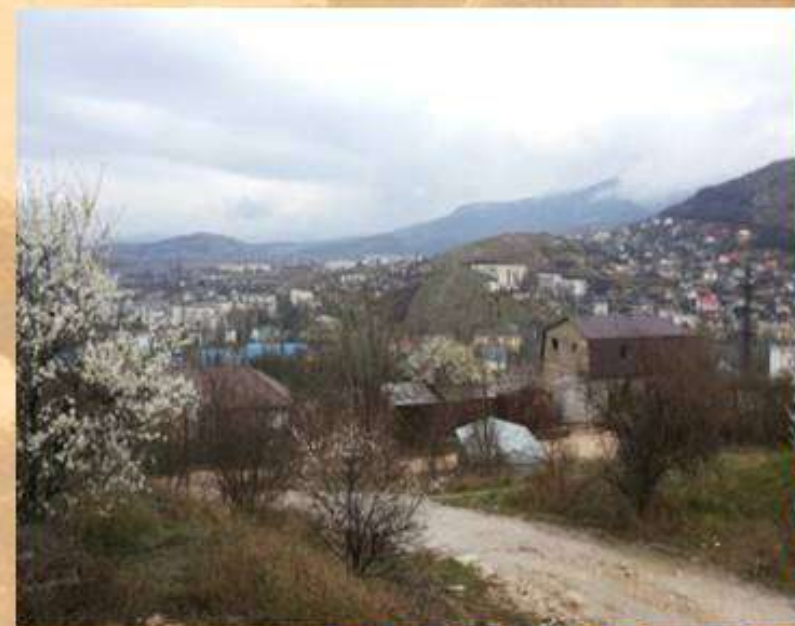
Улица имени В.Ф. Жукова