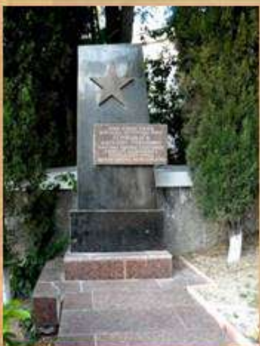
Памятный знак на улице Терлецкого в Балаклаве