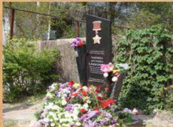
Памятный знак на улице А.Х Чакряна