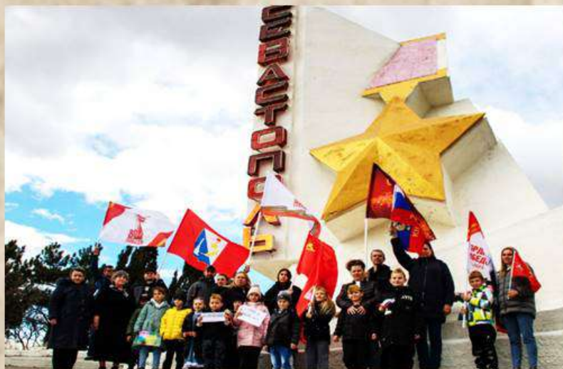
Переключка поколений в День Героев России

В Балаклаве, как и по всей России, День героев Отечества отмечается с особым размахом. Открываются новые памятники, улицы, скверы и аллеи Героев. Проводятся праздничные акции, Вахты памяти, походы и автопробеги по местам боевой славы, переключки поколений, тематические выставки, концерты. В школах и библиотеках проводятся встречи, классные патриотические часы, уроки мужества. Они необходимы, чтобы сохранить память о каждом герое, который навсегда вписал своё имя в историю родного города и страны. Герои живы, пока живёт наша память о них.