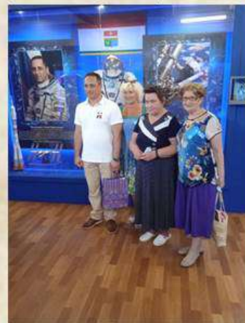
Открытие выставки в Балаклаве

С 1998 года — старший лётчик-инструктор пилотажной группы «Небесные Гусары» Центра показа авиационной техники ВВС, затем — командир эскадрильи авиаполка ВВС в городе Кубинка Московской области. Летал на самолётах Л-39 и МиГ-29. 29 мая 2003 года решением Межведомственной комиссии был зачислен в Отряд космонавтов для прохождения общей космической подготовки. 14 октября 2011 года стартовал с космодрома Байконур в качестве командира корабля «Союз МС-19» и удачно пристыковал в ручном режиме корабль к Международной космической станции. Является 521-м космонавтом мира и 111-м космонавтом Российской Федерации. Совершил четыре космических полёта к МКС, в ходе которых провёл три выхода в открытый космос — общей продолжительностью 21 час 39 минут. В общей сложности на орбите Земли космонавт находился 709 суток. Рекордсмен России по непрерывному пребыванию в открытом космосе.