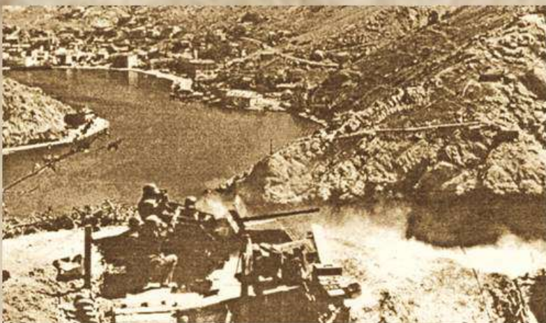
Балаклава 1941 год

Звание Героя Социалистического Труда и медали «За трудовую доблесть» учреждены Указом Президиума Верховного Совета СССР от 27 декабря 1938 года «Об установлении высшей степени отличия для награждения за трудовые заслуги». Текст Положения гласил: «Звание Героя Социалистического Труда является высшей степенью отличия в области хозяйственного и культурного строительства и присваивается лицам, которые своей особо выдающейся новаторской деятельностью в области промышленности, сельского хозяйства, транспорта, торговли, научных открытий и технических изобретений проявили исключительные заслуги перед государством».