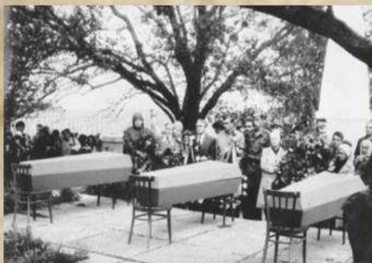
Перезахоронение в с. Оборонное

В ходе многолетней работы музейных работников, сотрудников Балаклавского военкомата, добровольных помощников, выявлены фамилии воинов. Памятник установлен на братской могиле, в которой похоронено около 3000 человек.