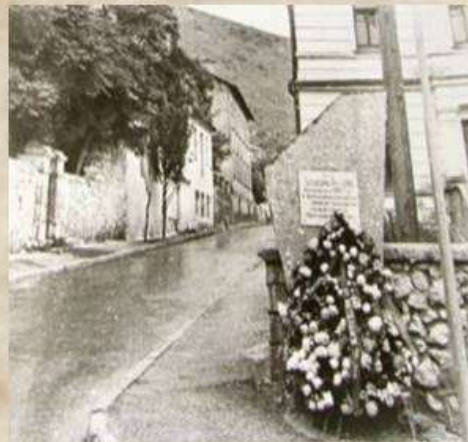
Начало улицы Г.А. Рубцова