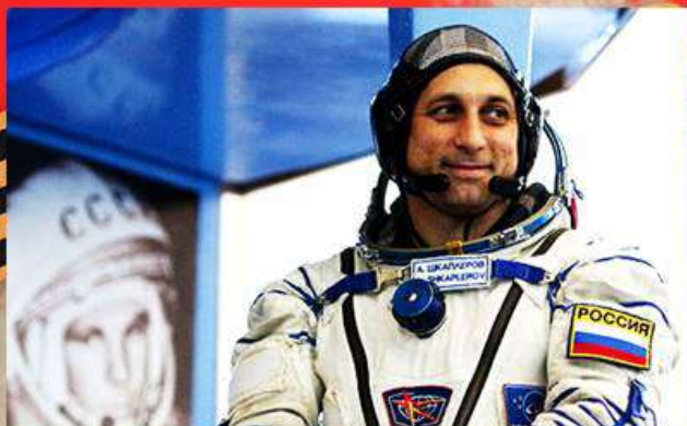
Космонавт А. Н. Шкаплеров