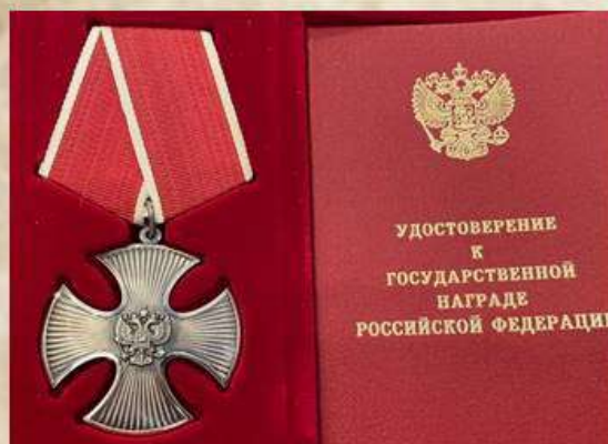
Медаль "За Отвагу"