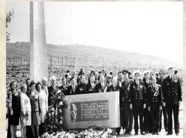
Обелиск на высоте Горной