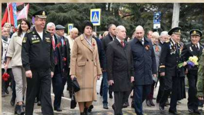
День освобождения Балаклавы 18 апреля 2025г.