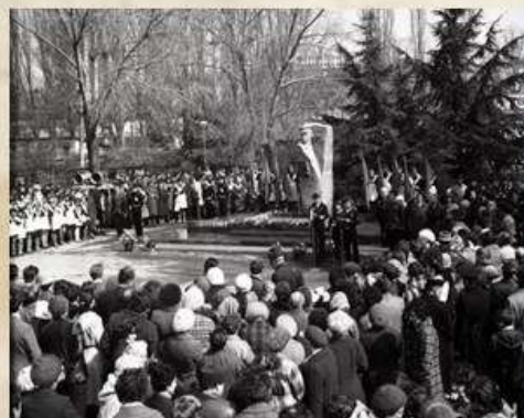
Открытие памятника П.Г. Новикову