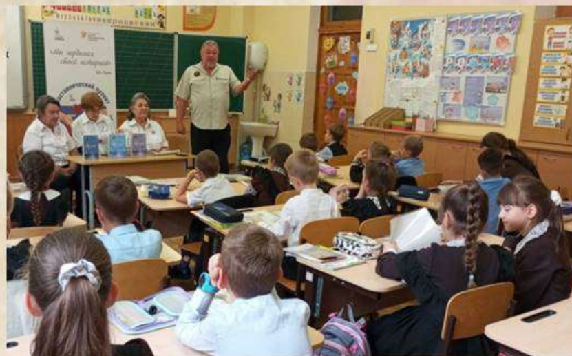
Члены Клуба истории проводят Урок мужества

В этот праздник россияне не только отдают дань памяти и зажигают свечи совершившим подвиги предкам, но и чтят ныне живущих героев нашей Родины. Когда-нибудь внуки и правнуки будут так же гордиться нашими сверстниками.