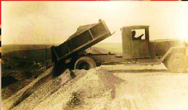
Балаклава 30-е годы. Рудник по добыче известняков

Звание Героя Социалистического Труда и медали «За трудовую доблесть» учреждены Указом Президиума Верховного Совета СССР от 27 декабря 1938 года «Об установлении высшей степени отличия для награждения за трудовые заслуги». Текст Положения гласил: «Звание Героя Социалистического Труда является высшей степенью отличия в области хозяйственного и культурного строительства и присваивается лицам, которые своей особо выдающейся новаторской деятельностью в области промышленности, сельского хозяйства, транспорта, торговли, научных открытий и технических изобретений проявили исключительные заслуги перед государством».