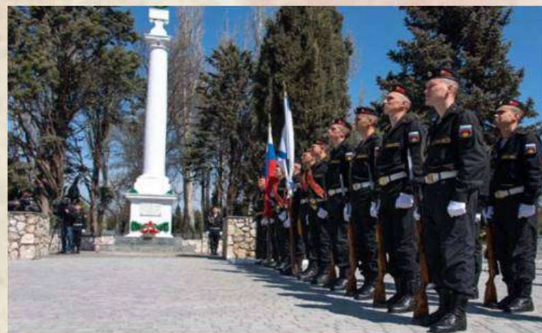
Вахта памяти у обелиска

Истории жизни и подвигов уроженцев Балаклавы — это яркие примеры верности воинскому долгу, стойкости и самопожертвования во имя нашей Родины. Истинное богатство любого народа, любого города — это трудолюбивые руки и горячее сердца его жителей.