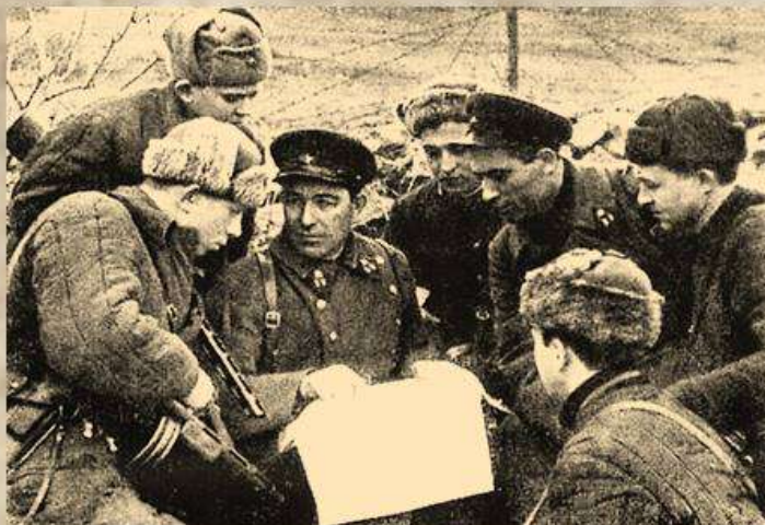
Инструктаж перед боем

Первый удар врага принял батальон курсантов школы НКВД. 17 ноября 1941 года к Севастополю вышли остатки 184-й стрелковой дивизии. Из них и пограничников, находившихся в Балаклаве, сформировали полк, получивший название «Сводный полк погранвойск НКВД», переименованный с 20 января 1942 года в 456-й полк 109-й стрелковой дивизии. Полк занимал ответственный участок обороны на южном фланге. Этот рубеж начинался от совхоза «Благодать» и кончался Балаклавской бухтой.