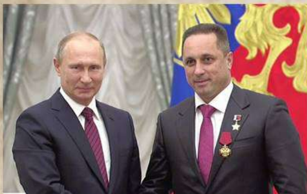
Вручение "Звезды Героя"

В 2013 году А.Н. Шкаплерову присвоено звание Героя Российской Федерации с вручением медали «Золотая Звезда» и почётного знака «Лётчик-космонавт РФ». 29 мая 2019 года награждён Орденом «За заслуги перед отечеством III степени».