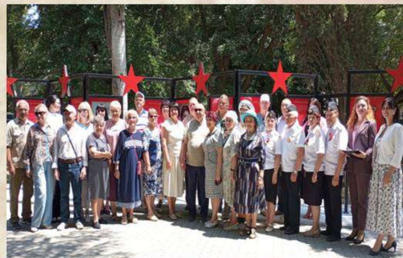
Участники торжественного открытия Аллеи

14 мая 1973г. Указом Президиума СССР было утверждено «Положение о Герое Социалистического Труда». Звание является высшей степенью отличия за заслуги хозяйственного и социально-культурного строительства. Оно присваивается лицам, которые проявили трудовой героизм, внесли значительный вклад в повышение эффективности производства, содействовали подъёму народного хозяйства, науки, культуры, росту могущества, славы и процветания страны.