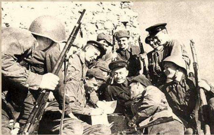
Защитники Балаклавы у стен крепости Чембало

Оборона Балаклавы продолжалась с сентября 1941 по июнь 1942 года. Сложность защиты маленького городка заключалась в том, что немецкие позиции находились в районе высот №212 и №386, с которых простреливался весь город. Проезд в Балаклаву, с учетом обстрела фашистами, представлялся делом опасным, движение допускалось только в темное время суток. Бойцы и местные жители ходили вплотную под скалами или по специально прорытым вдоль улиц окопам.