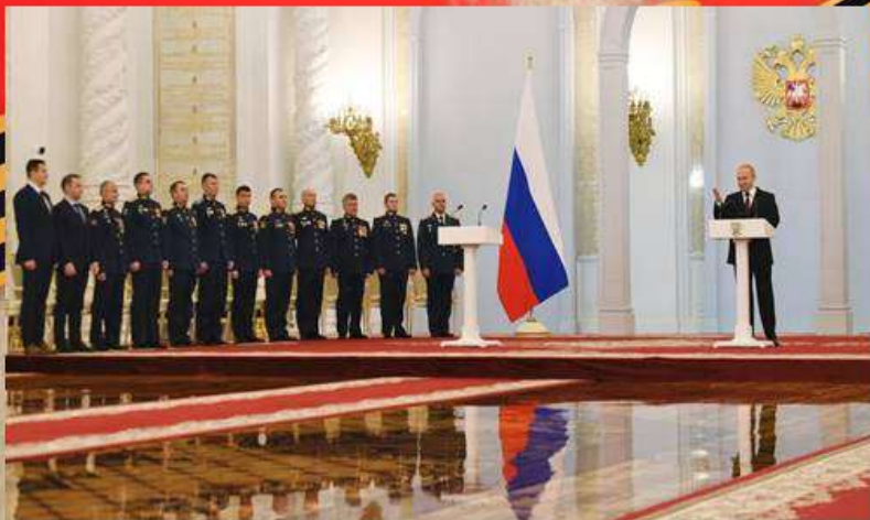
Вручение наград Президентом В.В. Путиным

В иерархии государственных наград Российской Федерации это звание находится на первом месте. При присвоении лицу звания Героя России на его родине, на основании указа Президента Российской Федерации, устанавливается бронзовый бюст с соответствующей надписью.