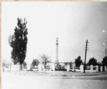
Мемориал погибшим воинам 1953 г.