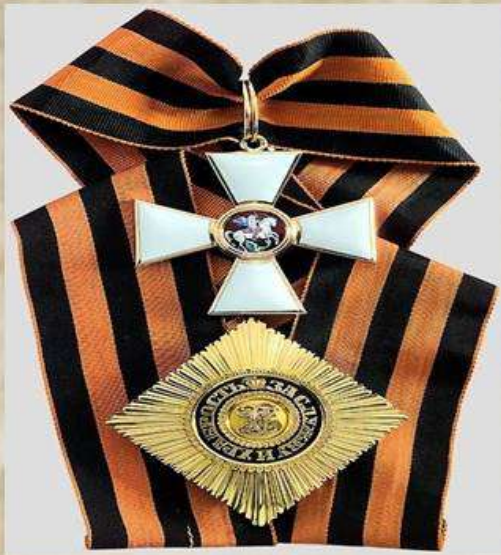
Орден Святого Георгия

Памятная дата 9 декабря приурочена ко дню, когда в России был учрежден Орден Святого Георгия. Это значимое историческое событие произошло в 1769 году во времена правления императрицы Екатерины II. К почетной награде были представлены офицеры и генералы, которые доблестно сражались в бою, проявили смелость и отвагу. Орден имел четыре степени отличия, им удостоились великие отечественные полководцы.