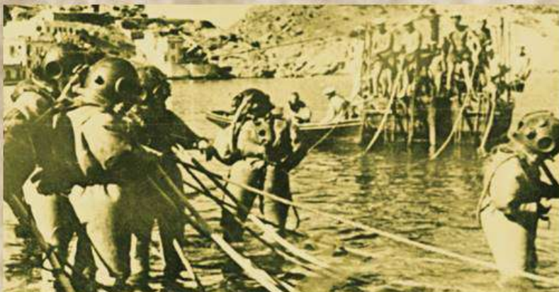
Балаклава 30-е годы. Учения водолазов

Ежегодно 9 декабря в Москве, в Георгиевском зале Кремля проходит почетный прием Президента Российской Федерации. На торжество приглашаются герои России, кавалеры орденов Славы и Святого Георгия. После Октябрьской революции, в молодой стране Советов, были учреждены государственные награды за образцовое выполнение специальных заданий и другие подвиги, совершённые в условиях мирного времени. Орден Красной Звезды учреждён Постановлением Президиума ЦИК СССР от 6 апреля 1930 года.