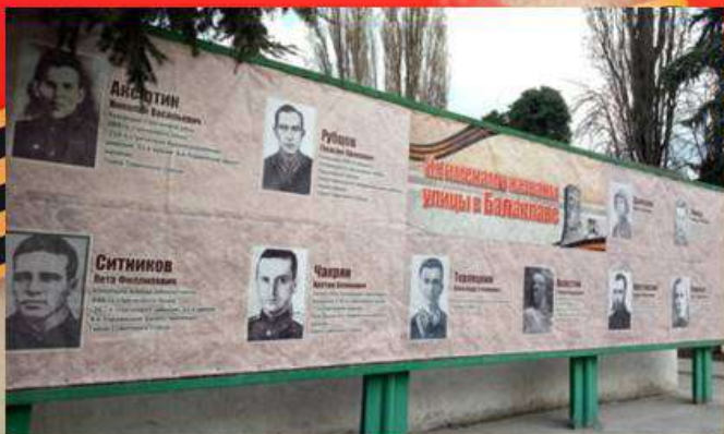
Именами героев названы улицы в Балаклаве