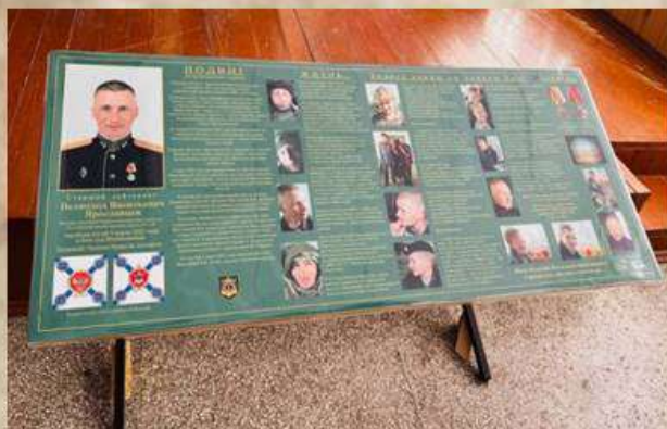
Парта Героя в школе №33