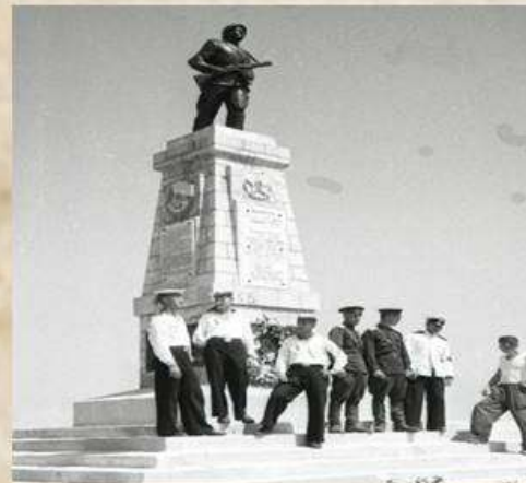
Памятник на горе Псилерахи