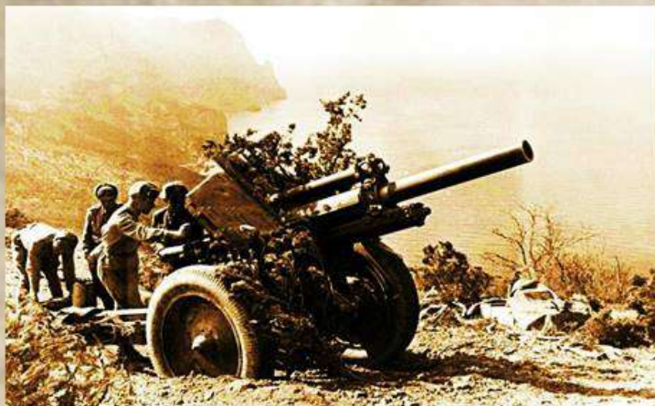
На подступах к Балаклаве 1944 год