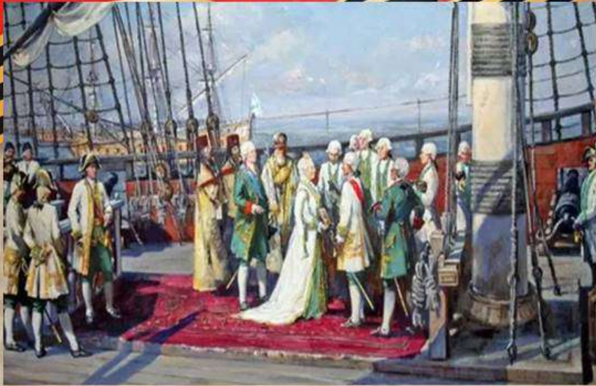
Вручение Ордена Св. Георгия А.В. Суворову

Памятная дата 9 декабря приурочена ко дню, когда в России был учрежден Орден Святого Георгия. Это значимое историческое событие произошло в 1769 году во времена правления императрицы Екатерины II. К почетной награде были представлены офицеры и генералы, которые доблестно сражались в бою, проявили смелость и отвагу. Орден имел четыре степени отличия, им удостоились великие отечественные полководцы.