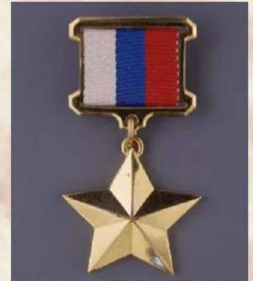
Звезда Героя России

Герой России — высшее звание, присваиваемое за заслуги перед государством и народом, связанные с совершением геройского подвига.