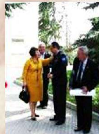
Встреча с балаклавцами