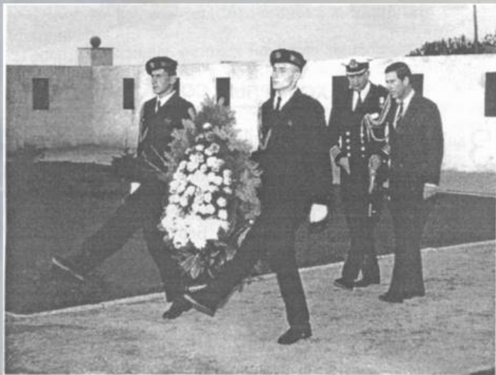
Р. Никсон на холме Кеткарта

В сентябре 1994 года в Балаклавской долине, в районе бывшего четвертого редута состоялось открытие памятника. Примирение держав — участниц Крымской войны 1853—1856 гг.». Для участия в этой церемонии прибыли члены Британской королевской семьи, послы Франции, Англии, Италии и Турции.