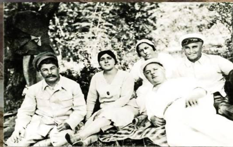
Сталин на отдыхе в Крыму 1925г.

Иосиф Виссарионович Сталин впервые приехал на отдых в Крым в августе 1925 года. На катере погранотряда он добрался до Мухалатки. Здесь, в доме отдыха ВЦИК № 4, его ждали жена Надежда и дочь Светлана. Там же пребывал командующий войсками Московского военного округа Климент Ворошилов. В один из дней, во время автомобильной прогулки, они посетили Балаклаву. Позже, И. В. Сталин ненадолго заезжал сюда во время своих визитов в Севастополь в 1929 и 1948 году.