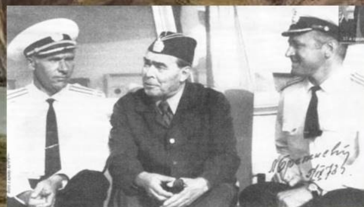
Л. И. Брежнев в Балаклаве