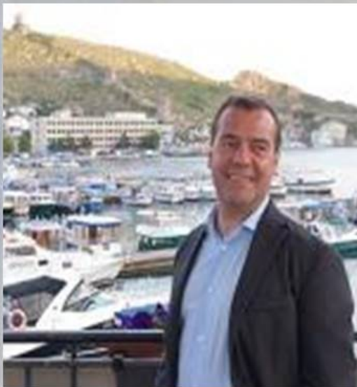
Д.А. Медведев в Балаклаве

В апреле 2015 года, впервые после возвращения Крыма в Российскую Федерацию, Балаклаву посетил Дмитрий Анатольевич Медведев. Он внимательно осмотрел оба берега и то, что осталось от правления украинской власти, пообещав жителям города, что в скором времени Балаклавская бухта станет флаговым туристическим объектом страны.