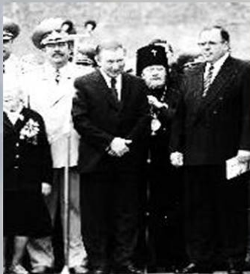
Визит Л. Д. Кучмы

Во время «Украинского периода», балаклавцам наиболее запомнился визит Леонида Даниловича Кучмы 26 апреля 2003 года. Подготовка к прибытию «хозяина» была тщательно спланирована и до мелочей продумана. Помыта набережная, покрашены фасады домов и правый борт кораблей (лицом к президенту), оборудованы места показа, подготовлены хлеб-соль, липовые доклады.