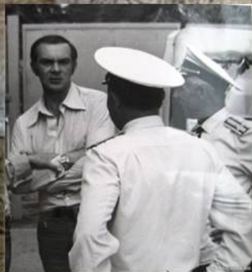
М. Магомаев в Балаклаве

С годами у балаклавцев сложилась верная примета — когда из бухты на всех парах выходил эскорт пограничных сторожевых кораблей и направлялся в сторону Мухалатки, это означало, что на наши крымские берега пожаловала очередная столичная правительственная «шишка»!