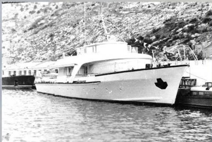
Правительственный катер в Балаклаве

Генеральные секретари Коммунистической Партии бывшего СССР знали толк в хорошем отдыхе и не упускали случая пройтись «с ветерком» вдоль черноморского побережья Крыма. Именно для этой цели были задуманы первые советские специализированные моторные яхты проекта № 360.