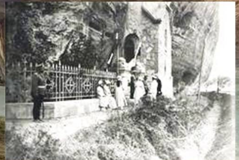
Царская семья в Инкермане

Участие в поездке австрийского императора под личиной графа Филькенштейна, а также послов Англии и Франции, позволяло продемонстрировать европейским государствам морскую мощь России, и вызвали соответствующую реакцию гостей. Однако главным, ради чего Екатерина II совершала столь длительное путешествие, было желание показать Европе, что Россия прочно встала на Черном море и в Крыму. После этого исторического события, все российские императоры (кроме Павла I) приезжали не раз в наших края.