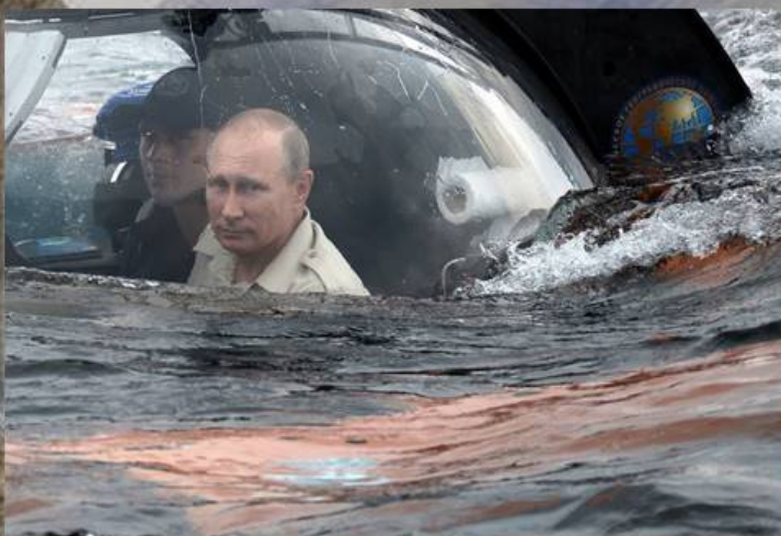
В.В. Путин у берегов Балаклавы

В апреле 2015 года, впервые после возвращения Крыма в Российскую Федерацию, Балаклаву посетил Дмитрий Анатольевич Медведев. Он внимательно осмотрел оба берега и то, что осталось от правления украинской власти, пообещав жителям города, что в скором времени Балаклавская бухта станет флаговым туристическим объектом страны.