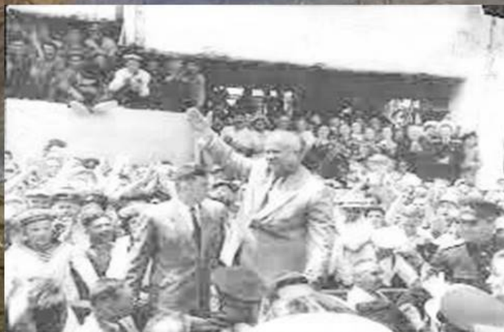
Н.С. Хрущев в Балаклаве