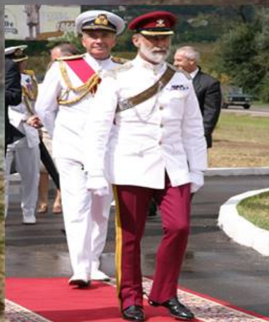
Герцог Кентский и Адмирал Вест

В 1992 году в Севастополь прибыл теплоход «Каледониан Стар» с семьюдесятью высокопоставленными англичанами и американцами. Среди них находились: экс-президент США Никсон, лорд Алан Каткерт, лондонский банкир Майкл Спрингрис. Гости желали осмотреть места Балаклавского сражения 1854 года, но дальше Кеткртова холма, где находится Английское кладбище, их не пустили. Только с выводом из бухты последней субмарины, представителям иностранных держав позволили преклонить колени на местах боев.