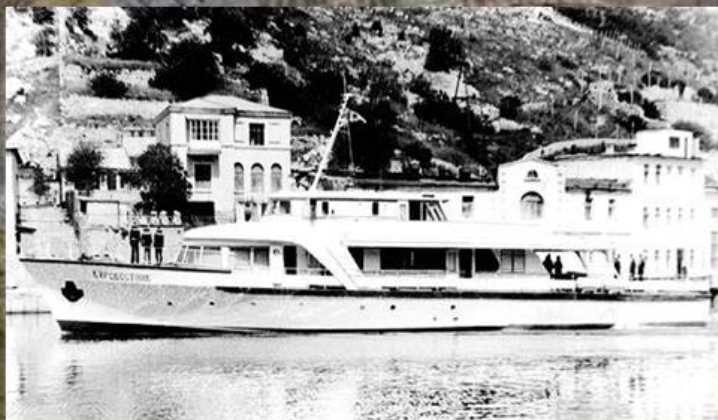
"Буревестник" в Балаклаве

При длине в 37 метров яхта имела вес до 150 тонн, а два мощных дизеля разгоняли ее до максимальных 37 узлов (почти 70 км.). Расход топлива был большим — до 500 литров в час, но кто в те времена считал такие мелочи (стоимость бензина на АЗС была 8-10 копеек за литр)? Основной материал корпуса — дерево. Выбор материала говорит о том, что во главу угла ставились вопросы экологии и комфорта элитных пассажиров правительства СССР. Бесшумность и отсутствие вибраций корпуса были главными задачами спецпроекта.