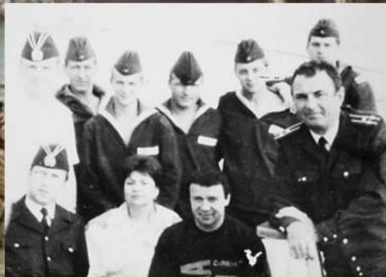
А. Кашпировский с женой