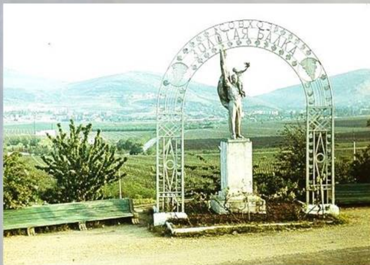
Вид с холма Араб-табиа

В послевоенные годы, начиная с 1954 года, Балаклаву несколько раз посещал Первый секретарь Центрального Комитета Коммунистической Партии Советского Союза Никита Сергеевич Хрущев.