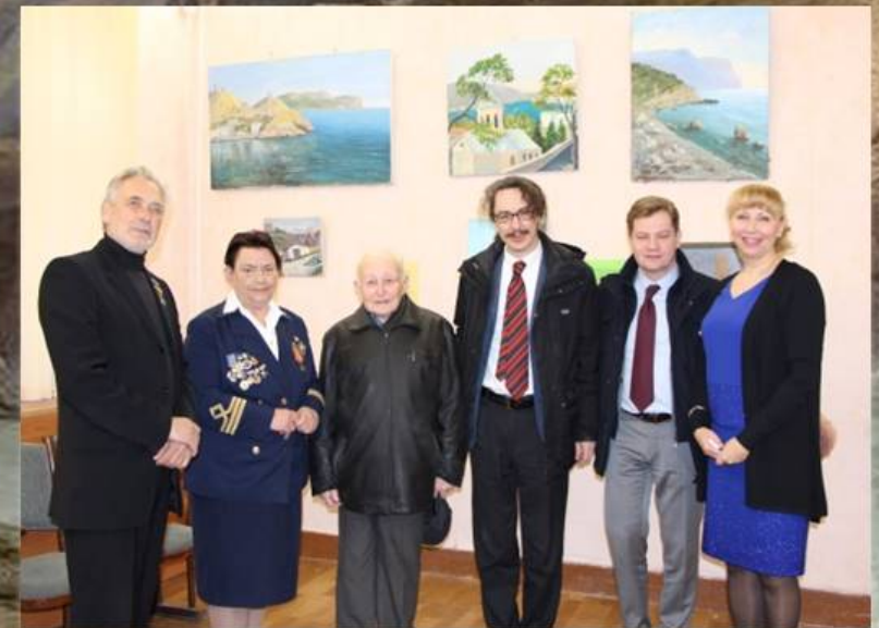
Делегация кинематографистов из Франции

И Балаклавцы всегда рады таким встречам! Им есть что показать и есть что рассказать о своем любимом городе накануне его 2520 юбилея!