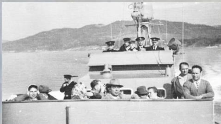
На борту "Буревестника"