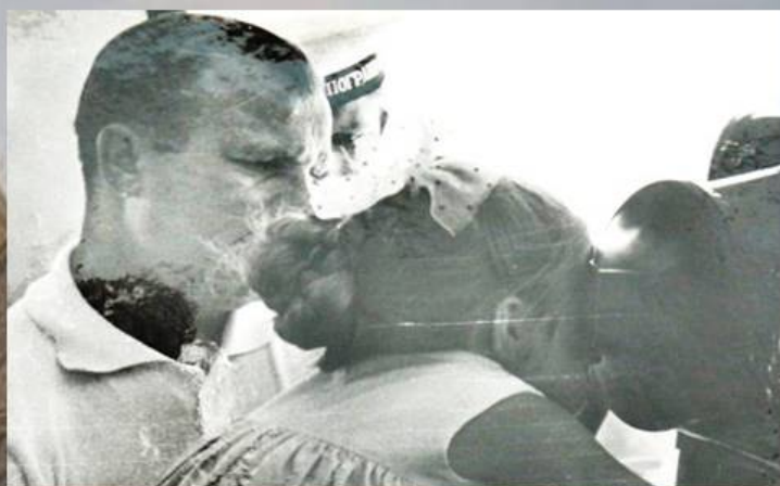
Ю. Гагарин с дочкой на мостике

На верхней прогулочной палубе был оборудован еще один салон и солярий. Девять отсеков были снабжены водонепроницаемыми дверями, и при полном затоплении даже трех из них, катер сохранял мореходные качества. Район плавания — порты Крыма и Кавказа. Штатная численность экипажа доходила до 14 человек, а командовал яхтой капитан не ниже чина первого ранга.