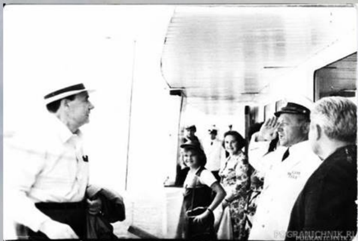
Министр А.А. Громыка с семьей

После демобилизации, многие молодые матросы с «Буревестника» оставались на сверхсрочную службу в отряде морских погранвойск. Позже, ветераны с теплотой вспоминали генсека Леонида Ильича Брежнева, который всегда живо интересовался делами экипажа и взял под личный контроль строительство жилых домов для пограничников в Балаклаве на улице Богдана Хмельницкого.