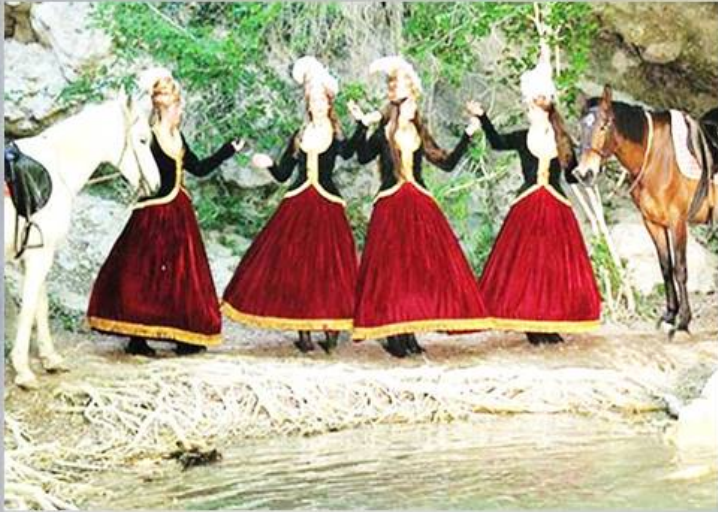
Встреча императрицы у Балаклавы

С незапамятных времен Балаклава не раз доказывала всему миру, что сумеет удивить даже самых изысканных гостей. Вскоре после присоединения Крыма к России, Екатерина II отправилась в дорогу из Петербурга в январе 1787 года, чтобы лично осмотреть новую жемчужину в своей короне — Тавриду.