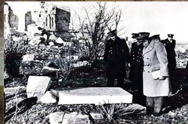
На Английском кладбище