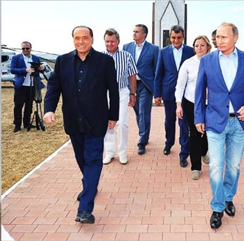
С.Берлускони и В.Путин в Балаклаве