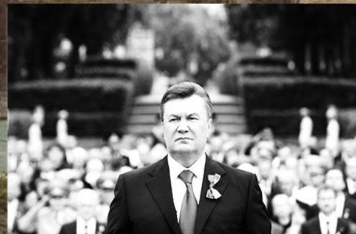
В.Ф. Янукович в Балаклаве