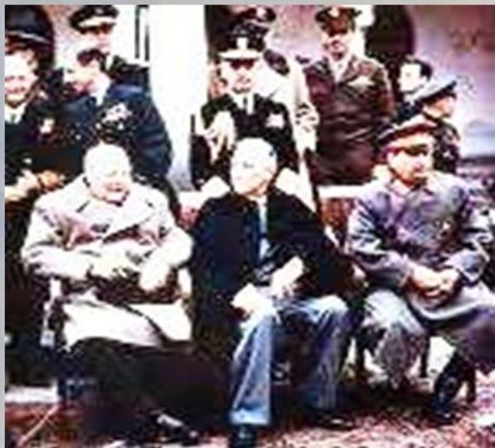
Участники Конференции 1945 г.

В феврале 1945 года, на время пребывания на Ялтинской конференции лидеров "большой тройки" — Сталина, Рузвельта и Черчилля, в Крыму были предприняты беспрецедентные меры безопасности. Охрану первых лиц обеспечивали тысячи сотрудников служб охраны, в том числе из Англии и США. Выполнялся любой каприз высоких гостей.