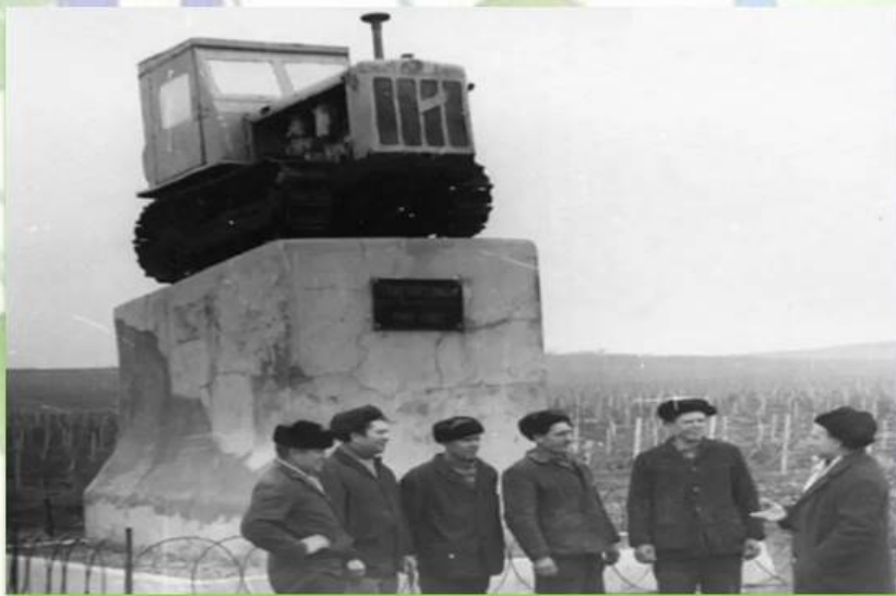
Механизаторы "Золотой балки" у памятника трактору КД-35

По существовавшим в то время нормам, полевой технике отпускали восемь лет эксплуатации. Но в руках опытного тракториста Филиппа Богачука КД-35 ходил по междурядьям два с лишним срока. После выхода на пенсию водителя, трактор занял свое почётное место на постаменте — у 1-го отделения среди виноградарей «Золотой Балки».