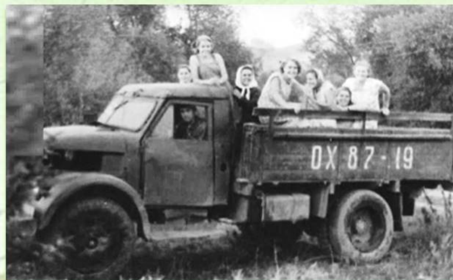
Садоводческая бригада "Бельбек"

Овощной и фруктовой житницей Севастополя стал совхоз №10, чьи отделения располагались в районе 5 и 7 километра Балаклавского шоссе, в Инкерманской и Бельбекской долинах.