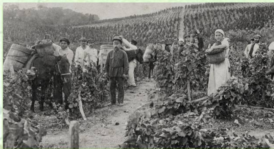
На плантациях совхоза "Профинтерн"

Несомненным лидером в сельском хозяйстве Балаклавы является виноградарство. История отрасли начинается с 1889 года, когда генерал-майор Александр Витмер построил на территории имения «Благодать» первый винный подвал по собственным чертежам.