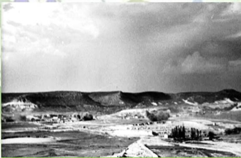
Селение "Новые Шули"

На месте бывших помещичьих усадеб возникали новые села. В 1928 году было произведено переселение жителей из деревни Шули (ныне Терновка) в село Новые Шули (послевоенное название — Штурмовое).