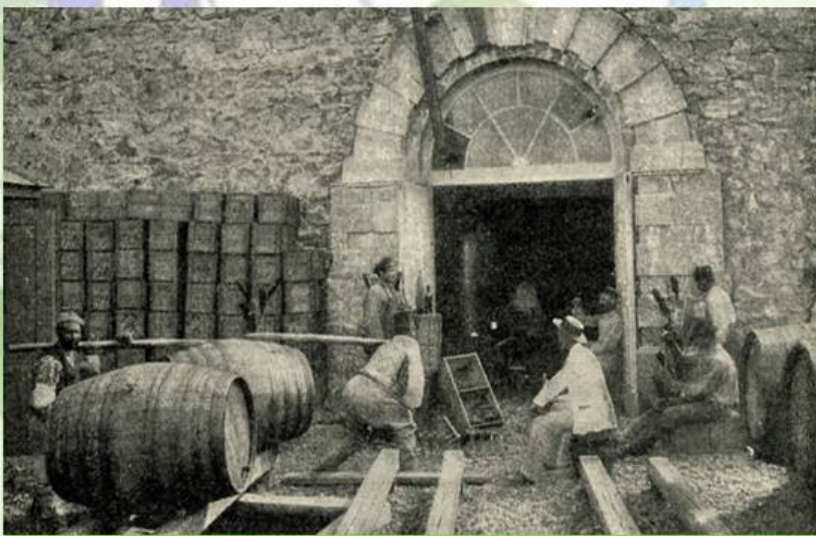
Винные погреба А.Н. Витмера