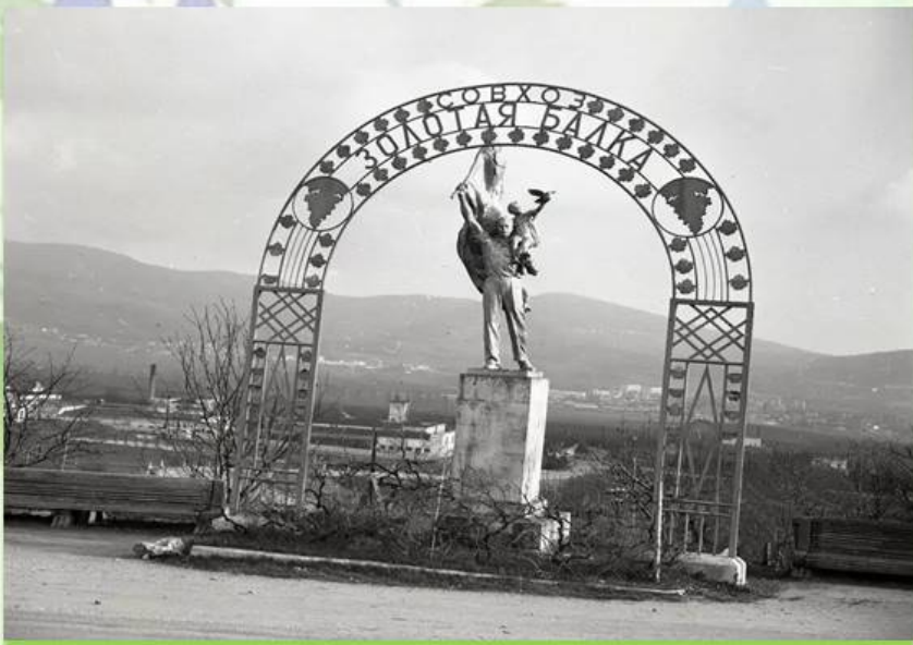
Балаклава конец 60-х годов 20 века

В 1986 году, по решению правительства Советского Союза, эти праздники объединили в один — «День работников сельского хозяйства и перерабатывающей промышленности агропромышленного комплекса», установив новую дату — ежегодно второе воскресенье октября.