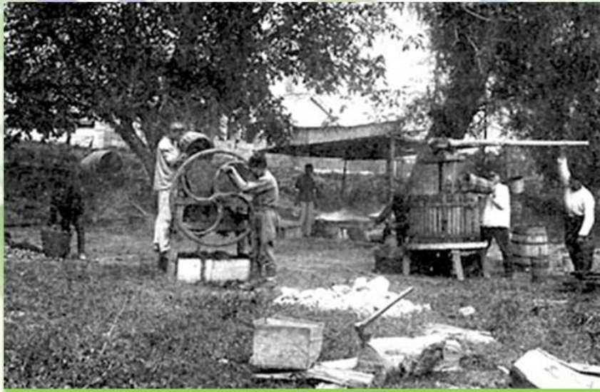
Шефская помощь в саду

На помощь труженикам села приходили рабочие и служащие городских заводов и фабрик — создавались шефские полевые бригады. Предприятия оказывали содействие в техническом оснащении совхозов и колхозов, производили мелкий сельхозинвентарь и ремонтные работы.