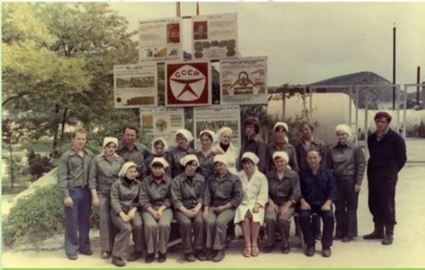
Бригада розлива сухих вин

Он был основан 1 февраля 1961 года. Были заложены первые марки вин: «Каберне», «Алиготе», «Рислинг», «Ркацители». Мощность завода составляет 1,05 млн. декалитров. Территория достигает 7 га, площадь винных подвалов — 55 000 кв. метров. Общая площадь виноградников — 2,79 тыс. га