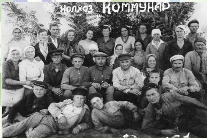
Колхозники деревни Чоргунь

В январе 1921 года хутора и поместья «бывших эксплуататоров» в Чернореченской долине и урочища Кара-коба прикрепили к Чоргуньскому сельсовету. Там создали советское хозяйство «Комунар». Угодья простирались от Черной речки до подножия горы Сахарная головка.