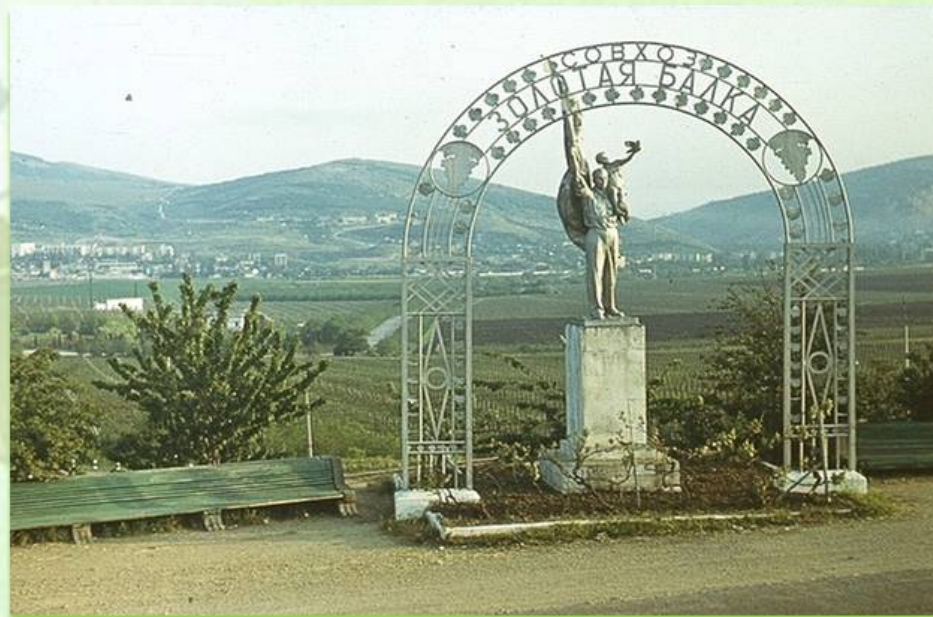
Балаклава конец 80-х годов 20 века

26 августа 1966 года указом Президиума Верховного Совета в СССР был установлен Всесоюзный день работников сельского хозяйства. С этого же дня советские колхозники начали получать зарплату — новая система оплаты пришла на смену трудодню. В том же, 1966 году в стране установили День работников пищевой промышленности.