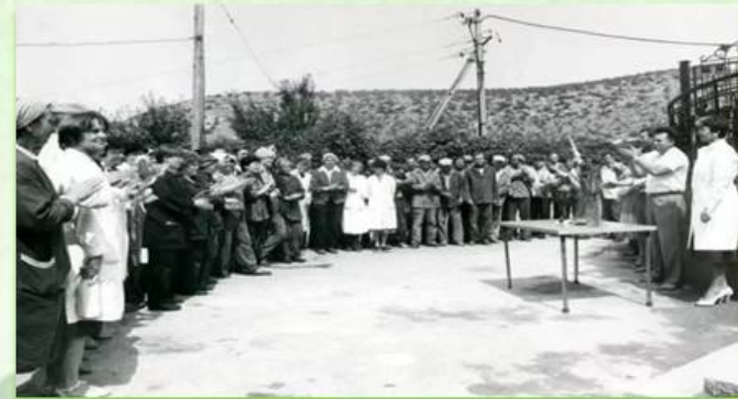
Директор А.М. Филиппов поздравляет передовиков завода

В Инкермане, оставшиеся подземные выработки после добычи известняков, были переданы городу для хранения сельхозпродукции. На глубине от 5 до 30 метров образовались штольни с постоянной температурой и влажностью, что стало предпосылкой для создания Инкерманского завода марочных вин.