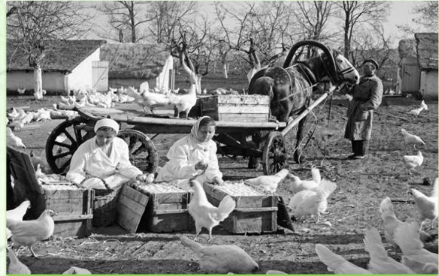
Молочная ферма в селении Бага

Осенью 1929 года на заседании бюро Севастопольского райкома было принято решение создать Трест для снабжения города продуктами питания.