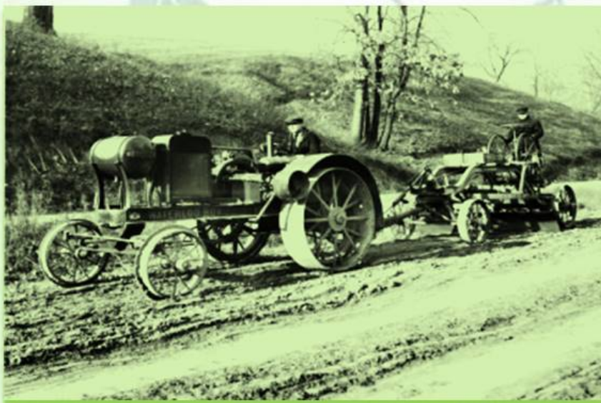
Первый трактор фирмы "Фардзон"

Не хватало инвентаря для полевых работ, семян для посадки огородных культур, саженцев для восстановления садов, вырубленных на дрова во время суровой зимы. Но самое главное — не хватало рабочих рук. Детский труд в совхозах был запрещен.