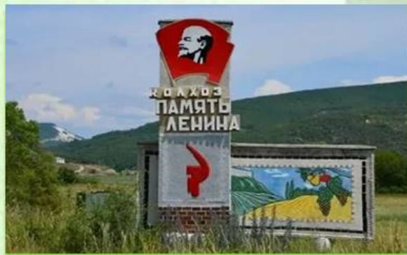
Знак на въезде в колхоз