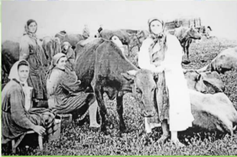
Доярки села Камары