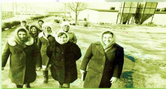
Птичницы совхоза "Красный Октябрь" 1983г.