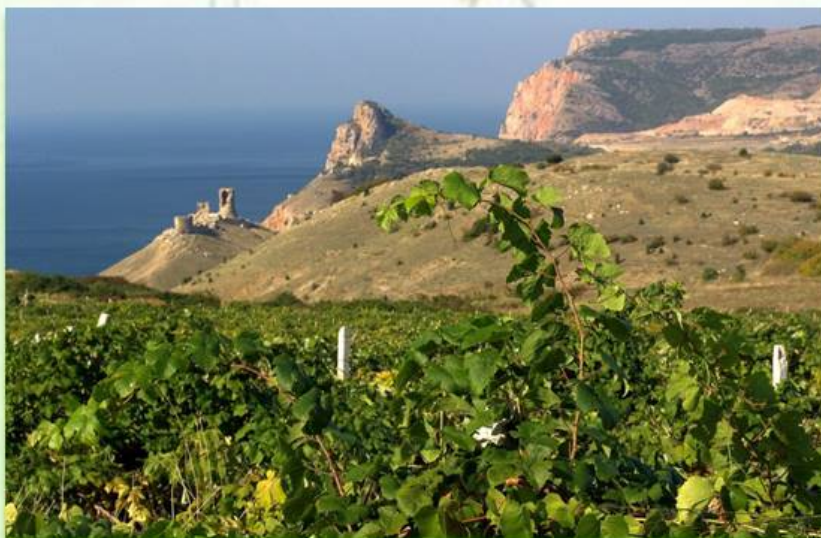
Плантации в балке Кефало-Вриси

Несомненным лидером в сельском хозяйстве Балаклавы является виноградарство. История отрасли начинается с 1889 года, когда генерал-майор Александр Витмер построил на территории имения «Благодать» первый винный подвал по собственным чертежам.