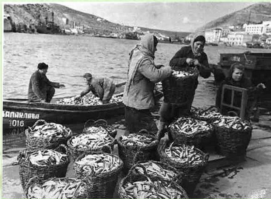
Балаклавский рыболовецкий колхоз «Путь Ильича» 50-е годы

Издавна наш край славился добычей рыбы. Ее ловили и в бухте, и в открытом море у побережья — в «макрельных заводах». Во главе каждой артели стоял атаман — наиболее уважаемый и удачливый рыбак.