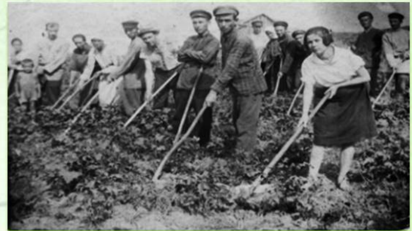
Городские служащие на сельхозработах

На помощь труженикам села приходили рабочие и служащие городских заводов и фабрик — создавались шефские полевые бригады. Предприятия оказывали содействие в техническом оснащении совхозов и колхозов, производили мелкий сельхозинвентарь и ремонтные работы.