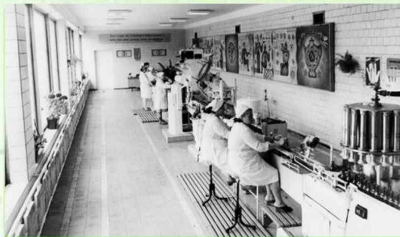
Лаборатория игристых вин

В 1960 году на базе «Золотой Балки» создаётся лаборатория и учебный центр «Школа виноградаря», а также производственный комплекс винзавода.