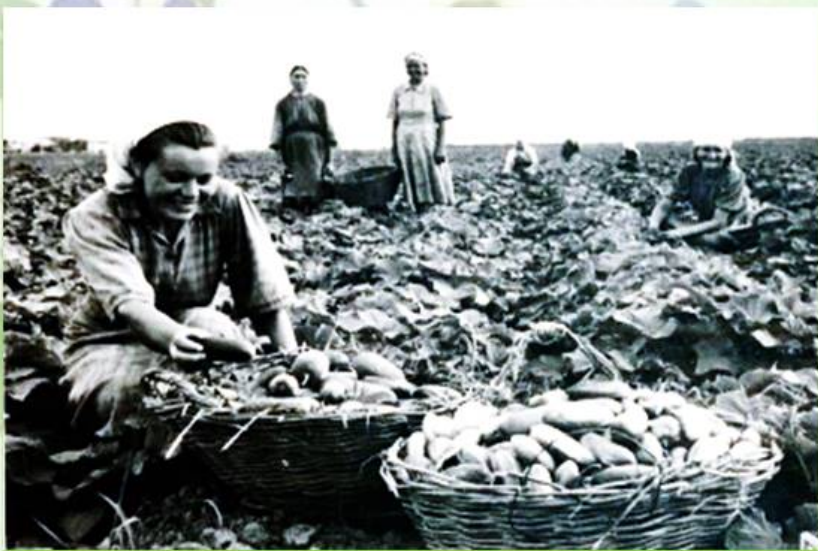
Сбор урожая в совхозе №10

Овощной и фруктовой житницей Севастополя стал совхоз №10, чьи отделения располагались в районе 5 и 7 километра Балаклавского шоссе, в Инкерманской и Бельбекской долинах.