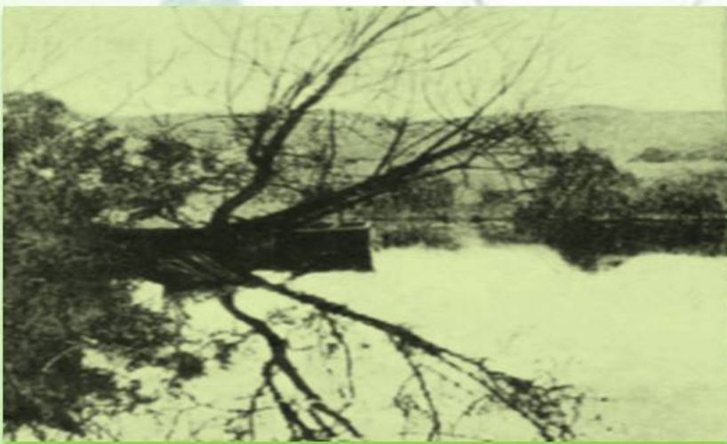
Пойма Черной реки

В пойме реки Черной, в районе нынешнего села Хмельницкое в 30-х годах располагалось форелевое хозяйство, где помимо рыбы, добывали раков.