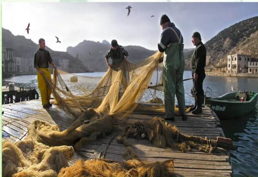
Балаклавские рыбаки сегодня

В 1917 году рыбаки Балаклавы объединились в кооперативно-производственное товарищество «Балаклавский рыбак». После войны организован колхоз «Путь Ильича».