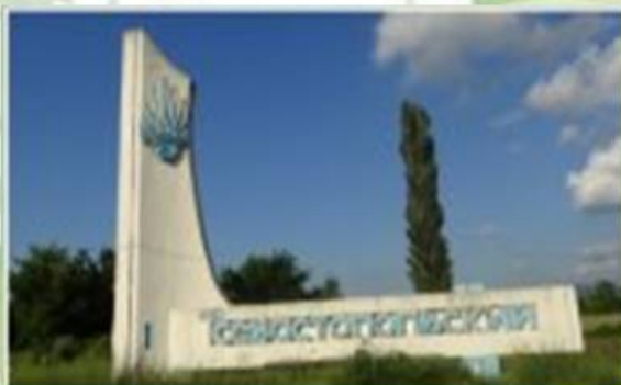
Стелла на въезде в совхоз