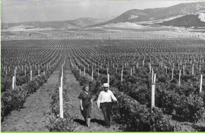
Плнтации Инкерманской долины

В Инкермане, оставшиеся подземные выработки после добычи известняков, были переданы городу для хранения сельхозпродукции. На глубине от 5 до 30 метров образовались штольни с постоянной температурой и влажностью, что стало предпосылкой для создания Инкерманского завода марочных вин.