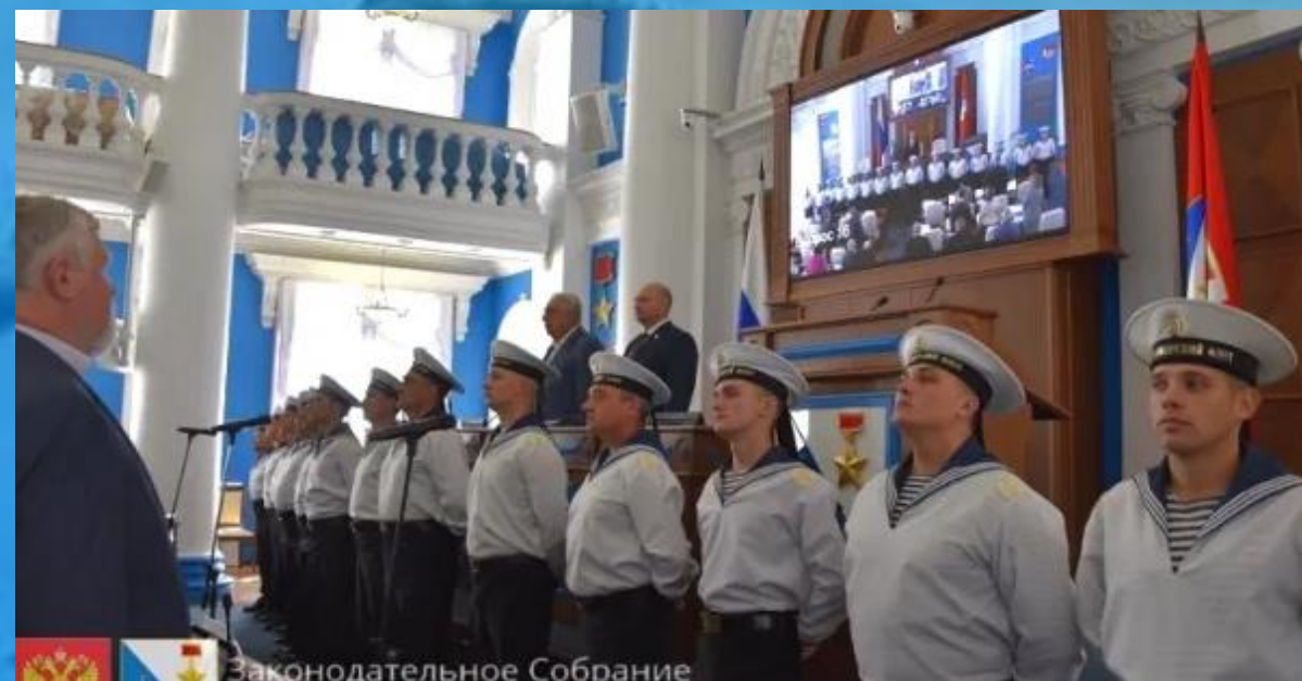
Гимн открывает очередную сессию Севастопольского Совета

Эту песню с воодушевлением исполняют дети на линейках в школе и ветераны флота с эстрады Приморского бульвара. Она стала гимном футбольной команды, представляющей наш город на Международных соревнованиях. Ее поют в столице на открытии выставки достижений регионов страны.