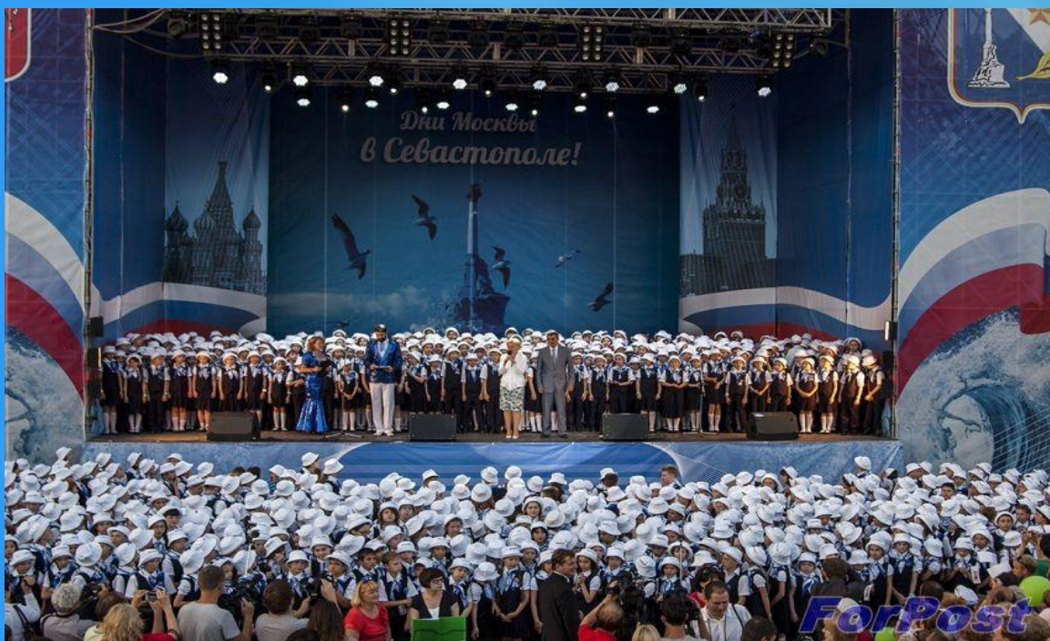
Сводный детский хор поет гимн Севастополя в Москве.

Поют и депутаты всех созывов перед началом очередного заседания Законодательного собрания Севастополя. Под нее уходят корабли в дальний поход и возвращаются к родным берегам. «Легендарный Севастополь» — это не просто гимн великому городу, музыкальное сопровождение торжеств и радио-телевизионных передач.