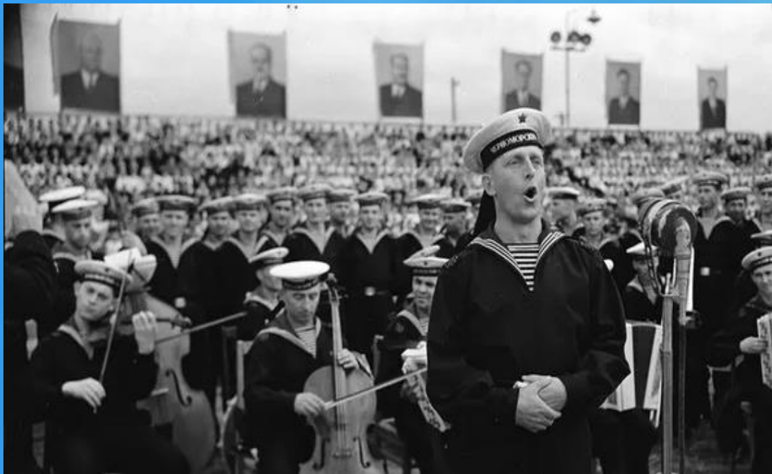
Сводный военный оркестр

17 октября 1954 года в 10 часов утра на стадионе Черноморского флота песню пел пятитысячный объединенный хор моряков, жителей Севастополя, участников художественной самодеятельности. Эхо многократно раздавалось по всему городу.