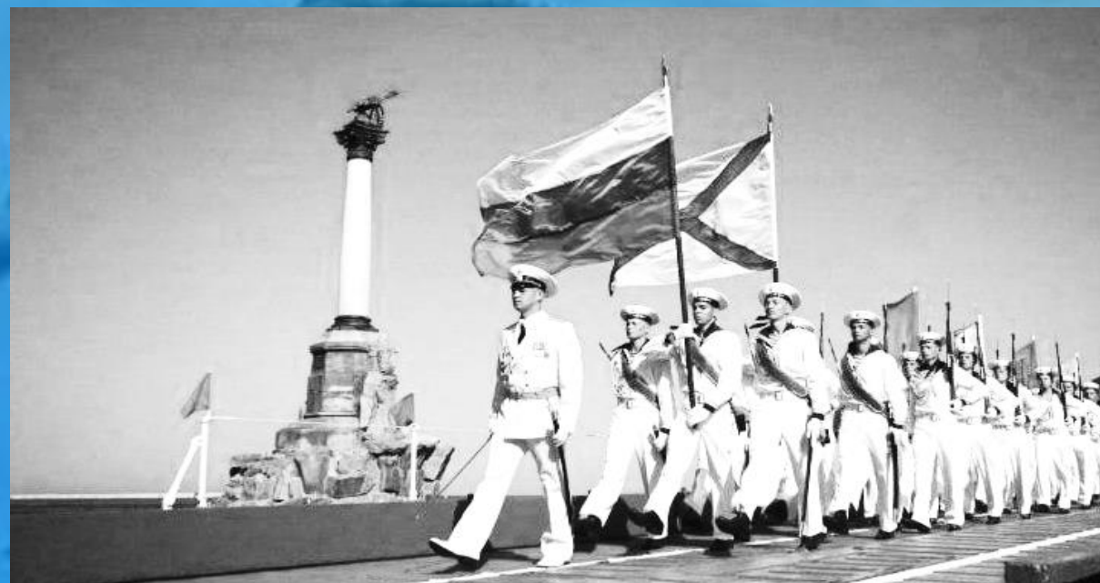
Парад под Андреевским флагом!

Во времена распада СССР и раздела флота, бурю возмущения народа вызвал "Легендарный Севастополь" переведенный на украинский язык, измененный в смысле слов гимн города-героя.