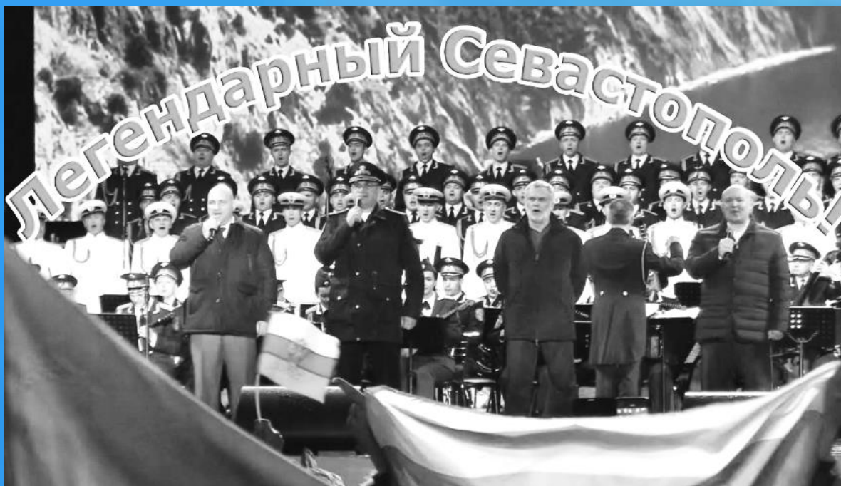
Севастопольцы на площади Нахимова поют гимн, март 2014г.

2. Гимн исполняется во время торжественных церемоний и иных мероприятий, проводимых государственными органами: при открытии и закрытии сессий городского Совета; при открытии памятников и памятных знаков; при встрече и проходах официальных делегаций и глав других городов; при открытии торжественных собраний.