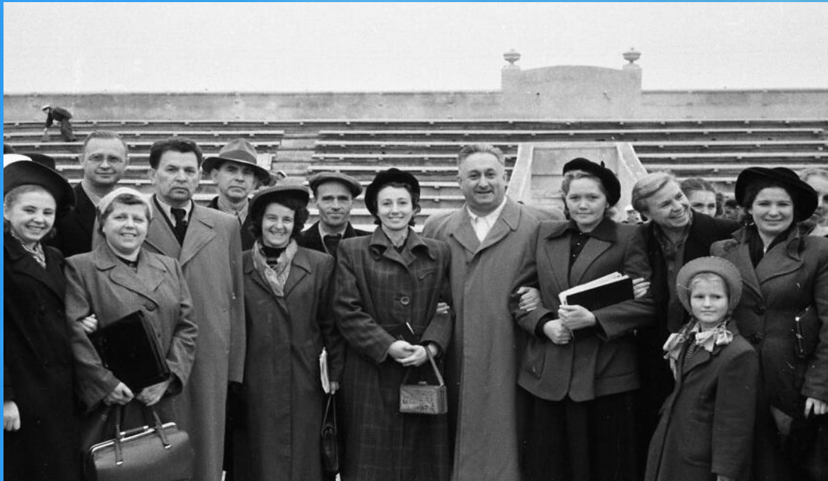
На стадионе КЧФ после репетиции

Работа над песней, даже спустя полвека с момента ее написания, продолжается и по сей день. Во флотских ансамблях, а так же в самодеятельных вокальных коллективах города, она непременно занимает первое место в репертуаре.