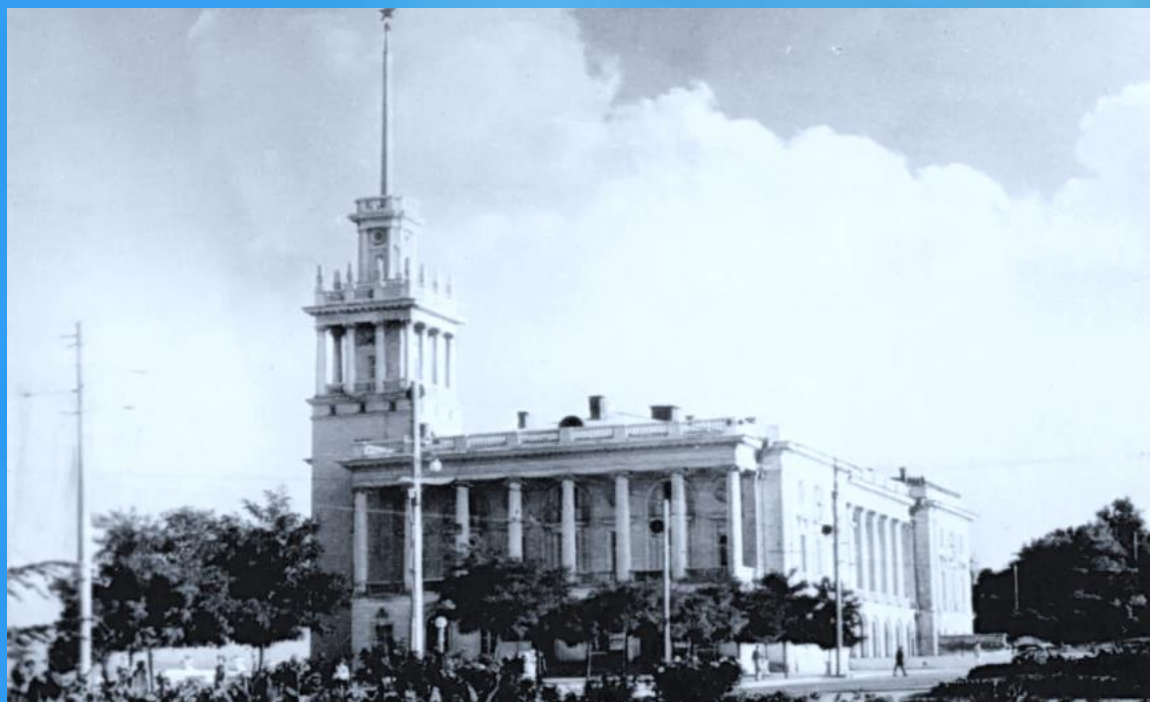
Севастопольцы впервые слушают бой курантов май 1964г.

Сегодня гимн «Легендарный Севастополь» живёт полноценной жизнью. Музыка гимна севастопольцы слышат каждый час — по центральному кольцу города она транслируется с боем курантов на часах с башни Матросского клуба. Мелодичный перезвон эхом разносится над бухтами и улицами города-героя.