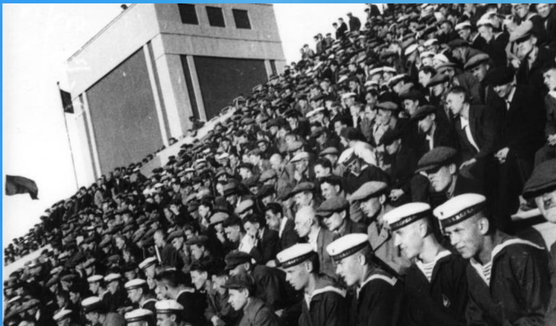
Болельщики поют гимн на футболе

7. При исполнении Гимна присутствующие выслушивают его стоя, мужчины без головных уборов, военнослужащие отдают честь.