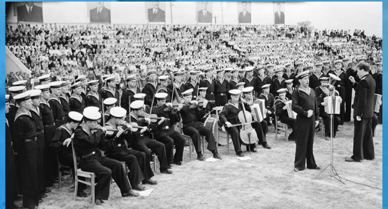
Репетиция 5-ти тысячного хора 1954г.

они принимали участие в ежедневных многочасовых репетициях. Как разучивали и исполняли эту песню, как потом встречались с авторами «Легендарного Севастополя», с руководителем и музыкантами Ансамбля Черноморского флота.