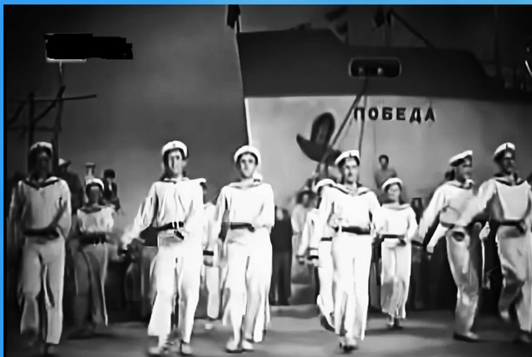
Концерт к десятилетию Победы

Патриотическая песня в жанре марша, где лейтмотивом являются слова «Легендарный Севастополь» и «Гордость русских моряков», в советское время входила в репертуар всех торжественных мероприятий города, а на флоте, у причалов, под нее встречали и провожали корабли.