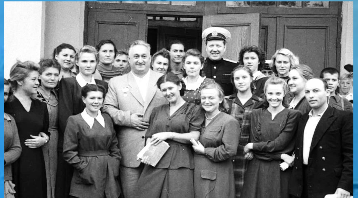
В.И. Мурадели с учителями Севастополя

Идея написания «Легендарного Севастополя» у композитора В.И. Мурадели возникла еще в 1944 году, когда он, во главе Центрального ансамбля песни и танца Военно-Морского Флота СССР, приехал в только что освобожденный Севастополь.