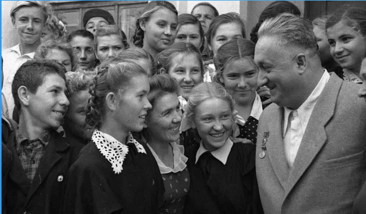
Ученики школы №15 с В.И. Мурадели

С самого своего рождения, мотив и слова «Легендарного Севастополя», буквально легли на душу каждого жителя нашего города. До сих пор многие севастопольцы, которые тогда были еще юными школьниками и студентами, вспоминают, с какой огромной радостью и с какой личной ответственностью