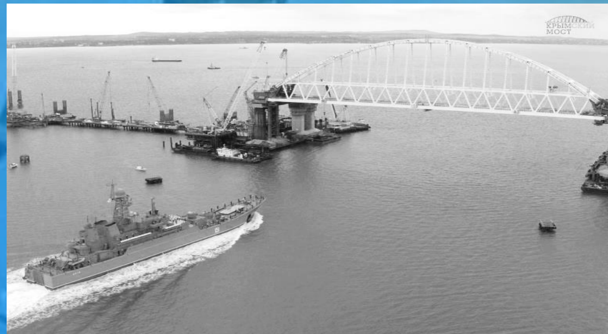
Гимн звучал на палубе БДК "Азов" у Крымского моста

5. Допускается исполнение Гимна при проведении городских спортивных соревнований.