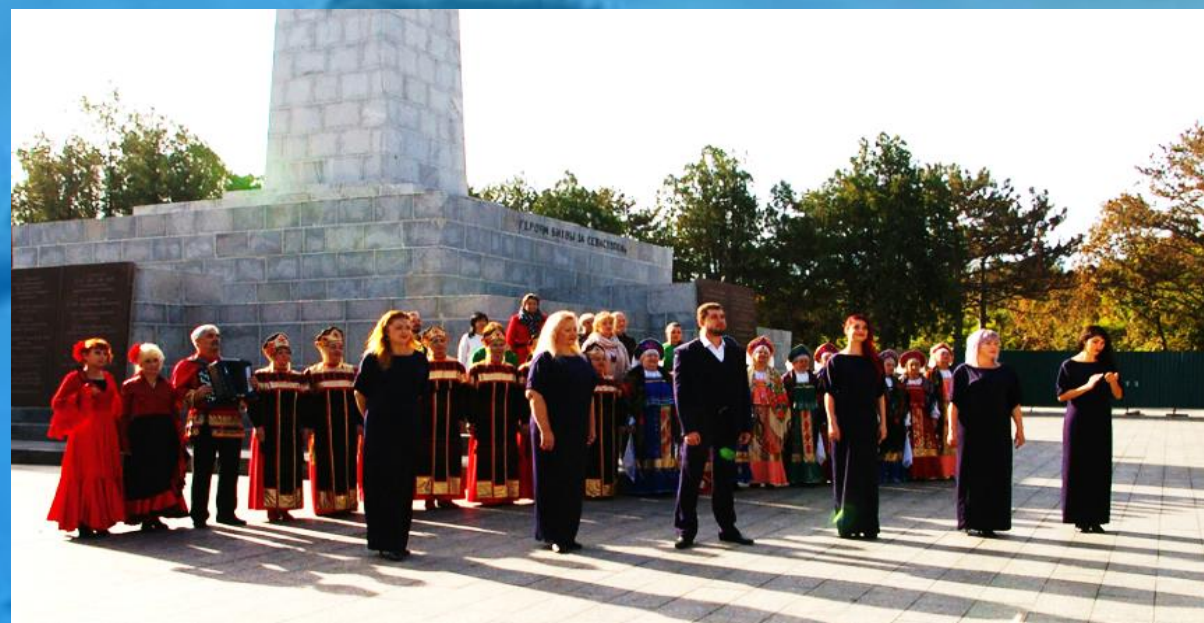
Коллективы Балаклавского Дворца культуры поют гимн на Сапун-Горе

Он как лоция для корабля, заходящего в бухту, безошибочно указывающая точку координат — принадлежность к России. Гимн наполняет наши сердца гордостью за свой родной город, за его героическую историю, за его верность своей Отчизне!