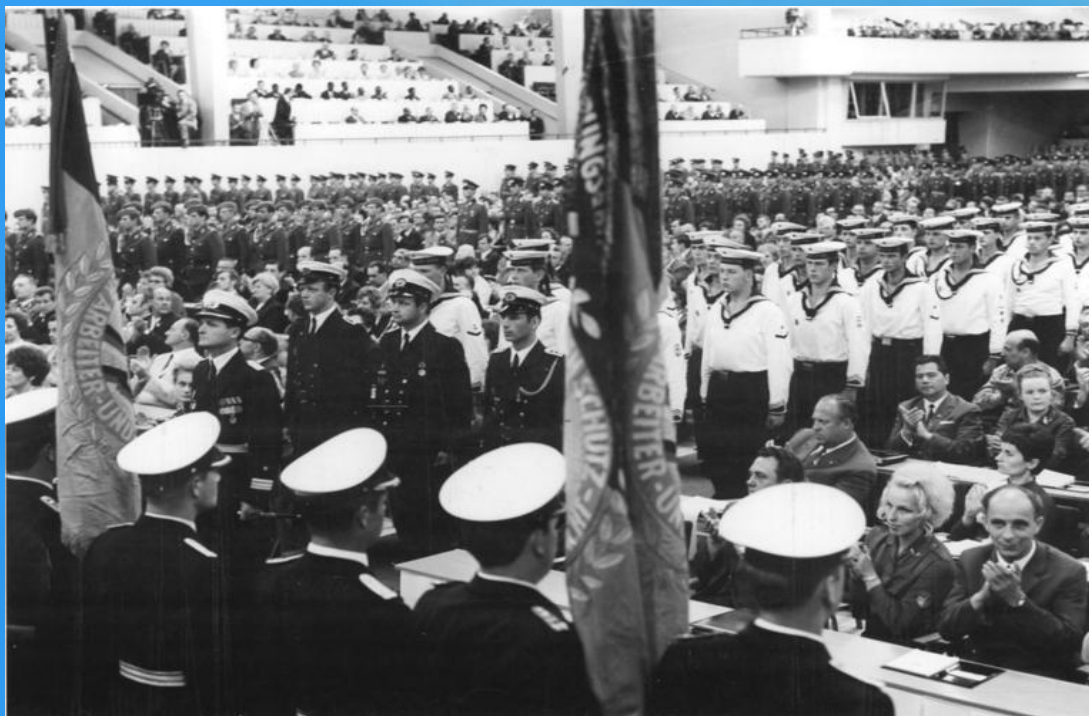
В Кремлевском Дворце съездов

В 2015 году, после присоединения Крыма к Российской Федерации, депутаты Законодательного собрания Севастополя запретили исполнение гимна города на украинском языке. "Легендарный Севастополь" вернулся в родную гавань под Андреевским флагом!