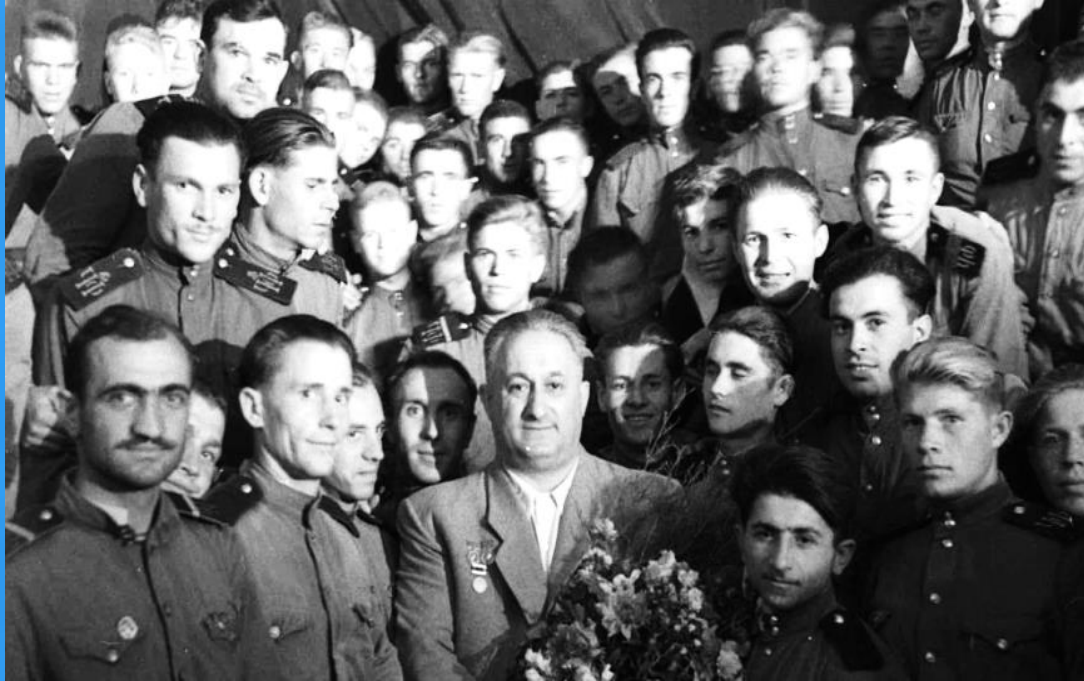
В. Мурадели с военными строителями в Севастополе

А через 10 лет, в июне – июле 1954 года по приглашению Военного Совета Черноморского Флота с целью создания песни о городе, известный композитор Вано Ильич Мурадели вновь посетил наш город. Здесь он встречался с жителями, школьниками, тружениками города и села, с военнослужащими.