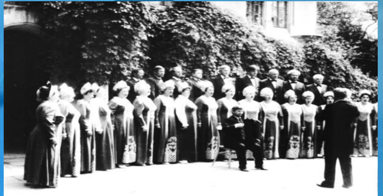
Хор "Верность" открывает гимном праздник в Херсонесе 1989г.

С годами появляются новые партитуры, музыкальные аранжировки, оркестровые и сольные партии. Песня продолжает жить и звучать в будни и праздники!