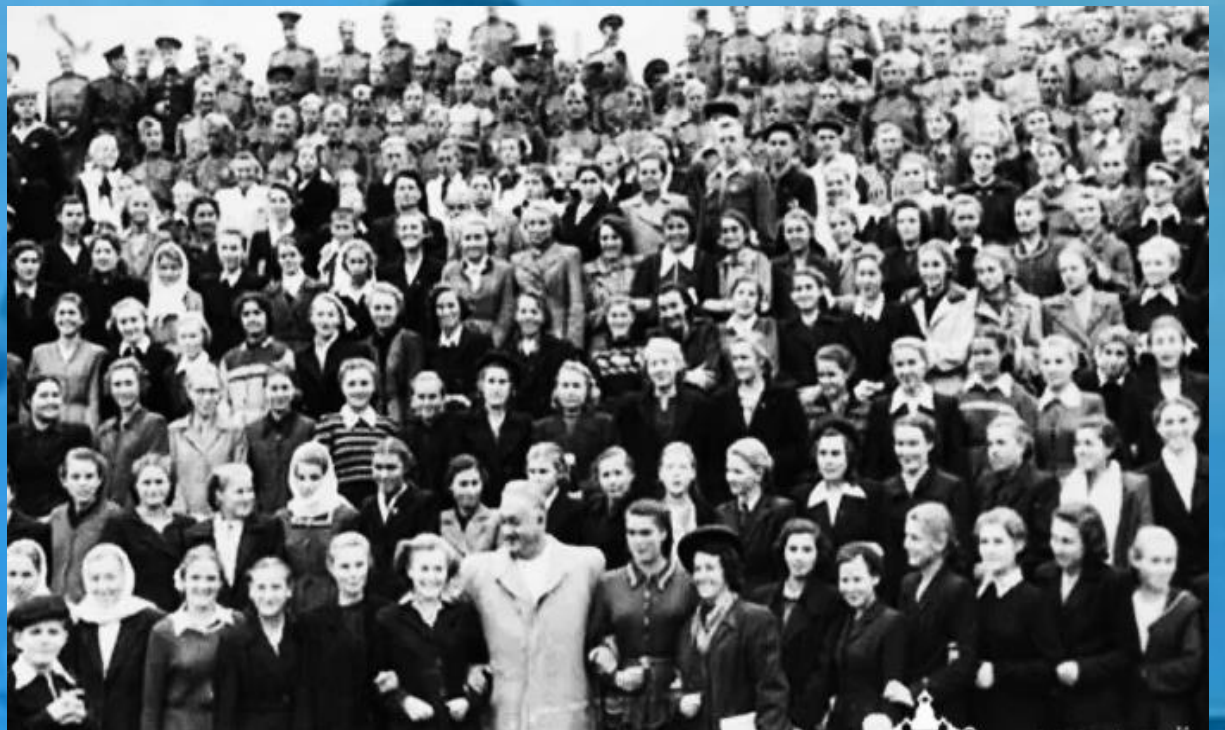
Вано Мурадели с исполнителями на стадионе

Впервые песня «Легендарный Севастополь» была официально исполнена в Доме офицеров флота летом 1954 года, в канун Дня ВМФ. Песню встретили на ура. Было принято решение исполнить ее на торжественном мероприятии, посвященном столетию обороны города 1854 — 1855 годов.