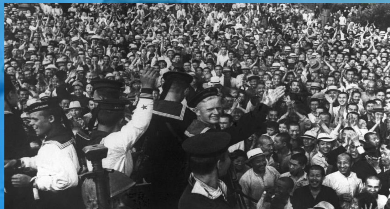
Советские моряки поют гимн на Олимпиаде в Корее

При вхождении в правовое поле России в 2014 году сразу же было принято Положение о гимне города Севастополя: I. Гимном города Севастополя официально является песня «Легендарный Севастополь».