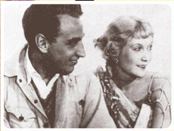
Г.В. Александров и Л.П. Орлова

Режиссёру Григорию Васильевичу Александрову руководством Мосфильма было поручено приступить к началу работ над «народной музыкальной комедией» в 1932-году — сразу же после его возвращения из трёхгодичной командировки по Северной Америке. Создатель первого отечественного мюзикла долго выбирал место для натурных съёмок картины.