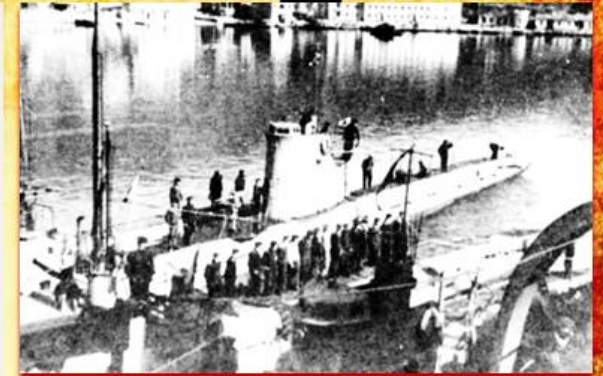
Балаклава - База подводных лодок 1947 г.

С 1945 года здесь была размещена дивизия подводных лодок, и городок превратился в одну из секретнейших военных баз в стране. На западном берегу, в горе Таврос, в 1953 - 63 годах построили подземный завод по ремонту подводных лодок — «Объект 825 ГТС». В 1957 году Балаклаву, из-за супер секретности этого объекта, административно перевели под юрисдикцию Севастополя, как закрытый район города. Но балаклавская экзотика по-прежнему привлекала кинематографистов