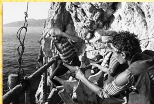
Съемки у мыса Айя