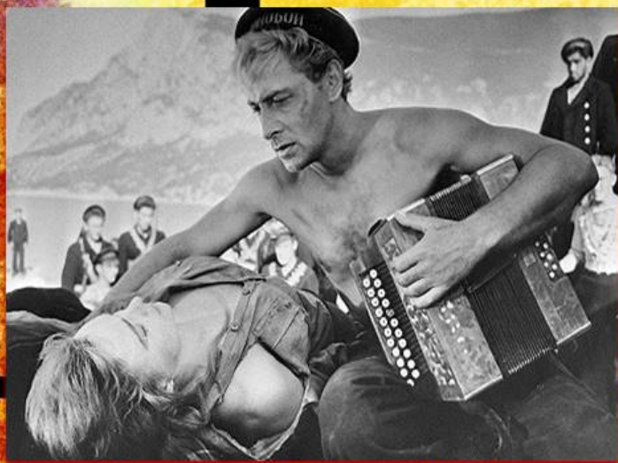
Съемка в Батилимане

Премьера «Оптимистической трагедии» состоялась в Москве, в кинотеатре «Россия». 12 июня 1963 года. Лента стала и лидером советского проката, и лучшим фильмом года. В том же году картина получила приз Каннского кинофестиваля, а на Международном кинофестивале в Мексике — премию «За правдивый показ русской революции». Актеры, занятые в фильме, удостоились престижных государственных наград и множества различных дипломов.