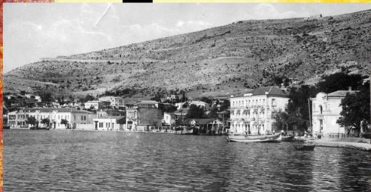
Балаклава начала 20 века. Слева - здание кинотеатра