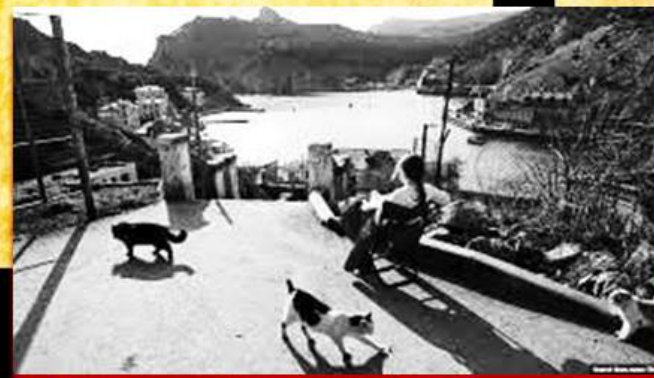
Фильм "За счастьем"

После ухода в 1994 году последней подводной лодки «Запорожье», снятия с городка секретности и демилитаризации Балаклавской бухты, кинематографисты утроили рвение снимать наш экзотический уголок, не затрачивая огромных средств на натурные съемки за границей. Балаклавку по праву называют отечественным Голливудом!