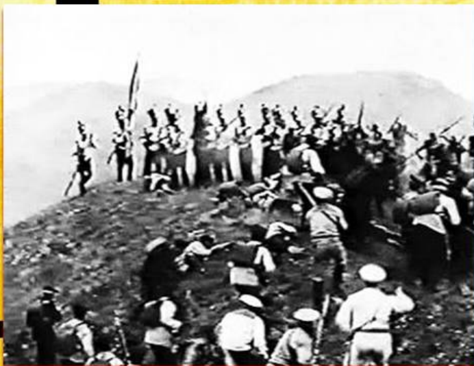
Кадр из фильма "Оборона Севастополя"

Осенью 1911 года в царской резиденции в Ливадийском дворце состоялась VIP-премьера "Обороны Севастополя" — зрителями были император Николай II, его многочисленная семья и высокопоставленные чиновники. А потом фильм с триумфом прокатился по городам и весям России и вошел в историю мирового кинематографа. Лента реставрировалась и сохранилась до наших дней.