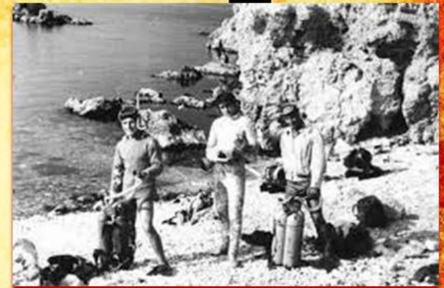
Подготовка к съемке в Ласпи

Бухта Ласпи сразу привлекла внимание по двум причинам: зеркально чистая вода и наличие места на берегу для размещения киношного оборудования, съемочной группы и морского вольера для дельфинов. К Ласпи вела грунтовая дорога, которой пользовались только лесники и пограничники. А в пионерлагерь, располагавшийся в тех окрестностях, детей подвозили из Балаклавы по морю на катерах.