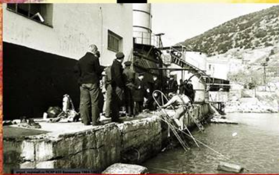
Водолазный полигон в Балаклаве

И военные, и гражданские жители Балаклавы оказывали киношникам всяческую помощь. Понятие «дайверы» в то время не существовало. В подводных сценах, наряду с профессиональными каскадерами, снимались мичманы с водолазного полигона Подплава. Матросы срочной службы с рейдовых катеров помогали с разгрузкой оборудования. Балаклавские рыбаки, помимо свежей барабульки и ставридки на угощение, выделили для съемок сети, якоря и тросы. Многие из них снялись «ловцами жемчуга» в эпизоде на шхуне. Вездесущая балаклавская детвора всегда была на подхвате — несмотря на строгий распорядок в пионерском лагере, умудрялась пробираться к берегу, где с утра до ночи работали кинематографисты.