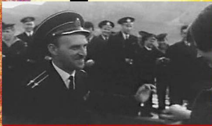
Фильм "Нейтральные воды"

Балаклавские моряки — подводники, водолазы, пограничники не раз становились действующими лицами в кинофильмах, посвященных службе на флоте. Это: «Нейтральные воды», «Акваланги на дне», «Одинокое плавание», «Секретный фарватер», «72 метра», «Водитель для Веры», «9 рота» и многие другие.